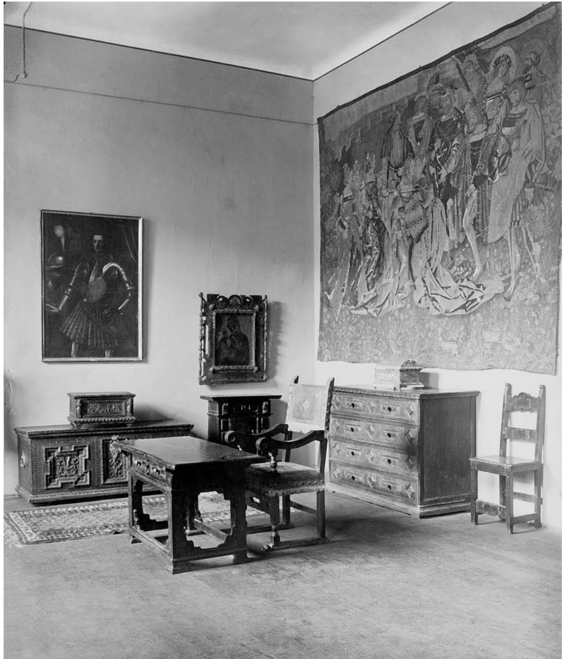
sl. 4. Dvorana renesanse. Stalni postav MUO, 1946.