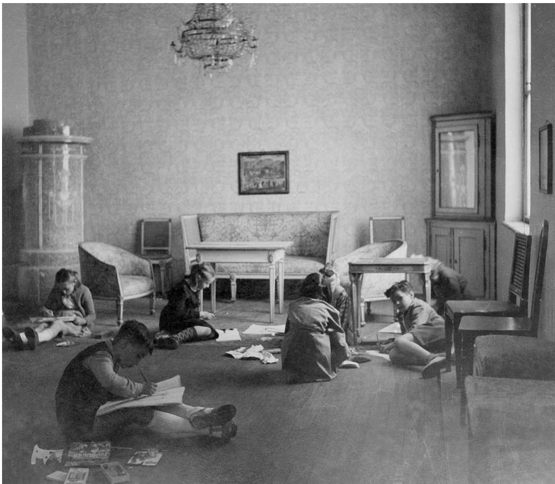
sl. 5. Dječja likovna radionica, Muzej za umjetnost i obrt, 1953.

konceptije izlaganja muzejskih predmeta. Iako je u to ratno vrijeme muzejska djelatnost umnogome usmjerena na spašavanje ratom ugroženih spomenika kulture (važnu ulogu u organizaciji i provedbi te djelatnosti imao je Zdenko Vojnović), ipak se ne zanemaruje ni redovita muzejska djelatnost. Tako se krajem 1942. i početkom 1943. organiziraju predavanja za stručno obrazovanje podvornika, koja se održavaju u dvorani stare knjižnice , a popraćena su projekcijama na novom muzejskom diaskopu . Osim djelatnika MUO, predavanjima prisustvuju i oni iz Etnografskog muzeja, a slušaju ih i stručni suradnici obaju muzeja.