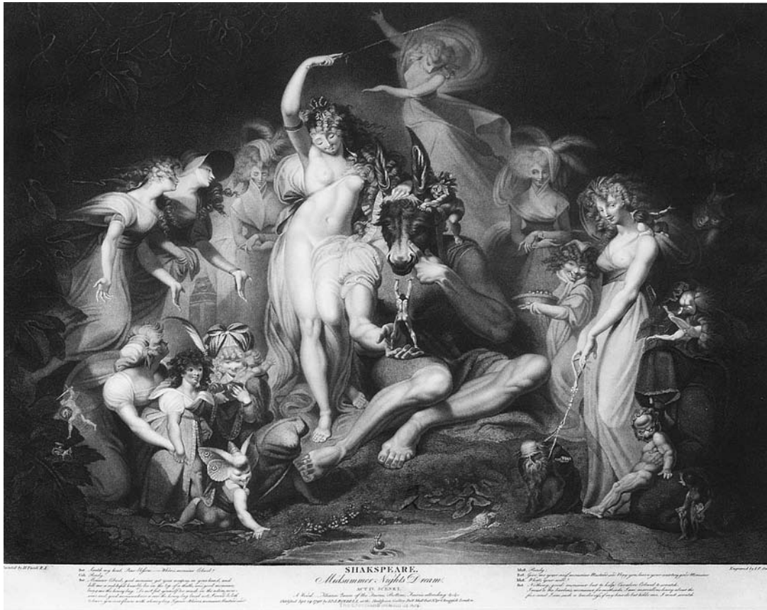
sl. 1. H. Fuseli, I. P. Simon: MIDSUMMER-NIGHTS'S DREAM. ACT IV. SCENE I.

MARINA LAMBAŠA □ Muzej grada Šibenika, Šibenik