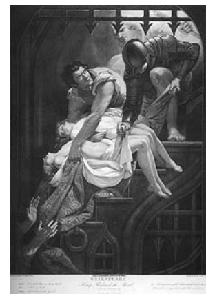
sl. 7. J. Northcote, W. Skelton: KING RICHARD THE THIRD. ACT IV. SCENE III.