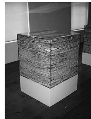
sl. 5. Tonka Maleković, Karantena, 2007. multimedijalna instalacija, kombinirana tehnika, dimenzije promjenljive

Zlatan Vehabović stvara slike precizne mrežaste strukture, a niz manjih formata čini veći format. Njegove su slike istodobno i narativne i apstraktne, u njima se isprepleću elementi povijesti umjetnosti i realnosti. Umjetnik želi da promatrač doživi sliku neovisno o temi, mediju i stilu te na na osnovi svog iskustva sam stvori novu vezu između realnosti i slike.