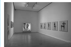
sl. 12.-30. Fotografije stalnog postava, povremenih izložaba i događanja koje su se u Ludwig muzeju Budimpešta održavale od 2004. do 2006. godine

Rezultat svega toga je činjenica da nam neke stvari nedostaju. Primjerice, nemamo dovoljno manipulativnog prostora: iako kamioni mogu ući u zgradu i premda ih ondje možemo istovarivati, nema dovoljno mjesta. Nemamo ni dovoljno mjesta za smještaj vitrina, primjerice vitrina gostujućih izložaba, kao ni veliki fotografski studio, a i uredi su poprilično maleni i nema ih dovoljno. To su negativni aspekti cijele situacije. Jedan od pozitivnih aspekata je infrastruktura zgrade, koja je uistinu vrlo napredna. Imamo klimatizacijske uređaje i uređaje za kontrolu vlage, a i sustav rasvjete je odličan: to je neka vrsta kombinacije Cumto-Bell elektronike i Erkola te prirodne svjetlosti. Prirodno je osvijetljen samo treći kat, a u ostalim se dijelovima uglavnom koristimo umjetnom rasvjetom.