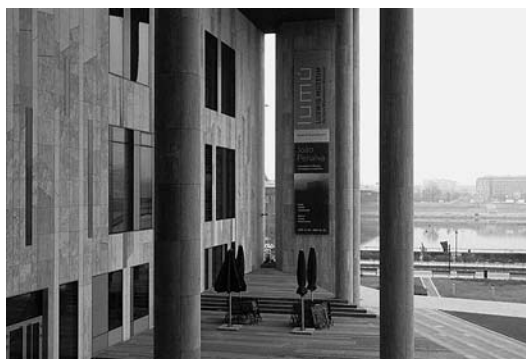
sl. 5. Pogled na jednu od izložbenih dvorana Muzeja Ludwig Budimpešta

željela napomenuti da mi u Mađarskoj nikad, apsolutno nikad ne bismo mogli skupiti toliku količinu umjetnina jer su djela koja su 1991. napokon stigla u Mađarsku tada vrijedila više od 40 milijuna njemačkih maraka. U Mađarsku su stigla vrlo važna djela. Bilo je među njima nekoliko slika iz kasnijeg razdoblja Picassova stvaralaštva, iz razdoblja američkog pop-arta i hiperrealizma te drugih.