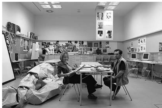
sl. 6.-11. Ludwig muzej i njegovi korisnici: muzejska knjižnica, igraonice, otvorenja izložaba

različitih zemalja. Zbirka koja je došla posredovanjem te organizacije sadržava djela pop-arta, futurističkog realizma, grafite, radove njemačkog neoekspresionizma, ukratko – za nas vrlo bitna djela. Talijani i Francuzi središnja su točka zbirke i sadržajno je uravnotežuju. David Hockney, Richard Hamilton, Gerhard Richter, Jean Tinguely, Jasper Jones, Robert Longo, Rosemarie Trockel te Arnulf Rainer samo su neki od slavnih autora čija su remek-djela u zbirci. Vrlo je važan element zbirke Ludwig tzv. neslužbena umjetnost Rusije ili bivšega Sovjetskog Saveza te drugih susjednih država. Djela prvotno preuzeta iz zbirke Ludwig karakteristična su za razdoblje prije devedesetih.