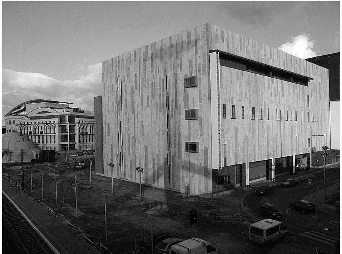
sl. 1.-4. Ludwig muzej Budimpešta – Muzej suvremene umjetnosti

Posebno me raduje što sam opet ovdje. Naime, kad sam posljednji put bila s vama, prije nekoliko godina, cijeli je ovaj novi zagrebački muzejski projekt bio još u povojima i arhitekt je tek objašnjavao svoje zamisli. A sad je projekt završen odnosno bliži se kraju!