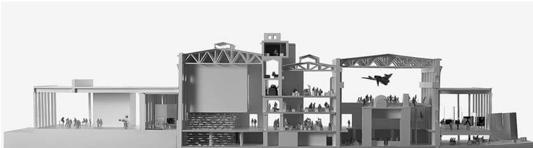
sl. 11.-12. Budući Muzej suvremene umjetnosti Riga – 3D simulacije zgrade i unutrašnjeg prostora