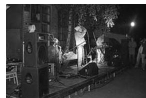
sl. 5-7. Noć muzeja 2005.

Što smo učinili? Najprije smo osnovali Odbor korisnika i zamolili dva letonska stručnjaka da održe predavanje