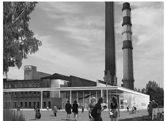
sl. 8.-10. Budući Muzej suvremene umjetnosti Riga – 3D simulacije zgrade © OMA (Office for Metropolitan Architecture)

o toj temi. Kontaktirali smo doktora Jānisa Garjānsa, voditelja organizacije zadužene za muzeje, Ojārsa Pētersonsa, umjetnika koji je sudjelovao na nekoliko natječaja za arhitektonski projekt muzeja te poznatog kustosa i muzeologa Norberta Webera iz Njemačke. Također bih željela istaknuti da nam je od velike pomoći bio i profesor Juhanni Pallasmaa, vodeći finski arhitekt koji je blisko surađivao sa Sevenom Hollom pri izgradnji Kiasme. Gospodin Pallasmaa zadužen je za održavanje Kiasme i odgovoran je za sva događanja u muzeju, a sudjelovao je i u golemom projektu Hampi centra u Helsinkiju. Zatim smo potpisali ugovor s građevinskim poduzetnicima zaduženima za lokaciju. Cijeli je prostor pod upravom tvrtke Građevinska agencija nova Riga . Oni su unajmili taj prostor i surađuju s nama. Napravili smo mali ustupak. Žuri nam se jer, kao što sam ranije napomenula, naš je projekt politički. Sljedeći su izbori već 7. listopada 2006. pa se moramo požuriti kako bi naš projekt do tada poodmakao tako daleko da se više ne može zaustaviti.