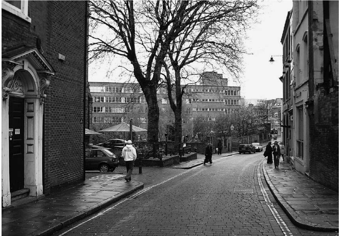
sl. 2. Fotografija dijela grada gdje će biti smješten Centar

Također se zalažemo za posve fleksibilnu definiciju suvremene umjetnosti koja bi odražavala činjenicu da se umjetnička praksa svakodnevno mijenja i da se istražuju nova područja te da suvremena umjetnost zalazi u druga područja ljudske djelatnosti i obuhvaća brojne aspekte suvremenog života.