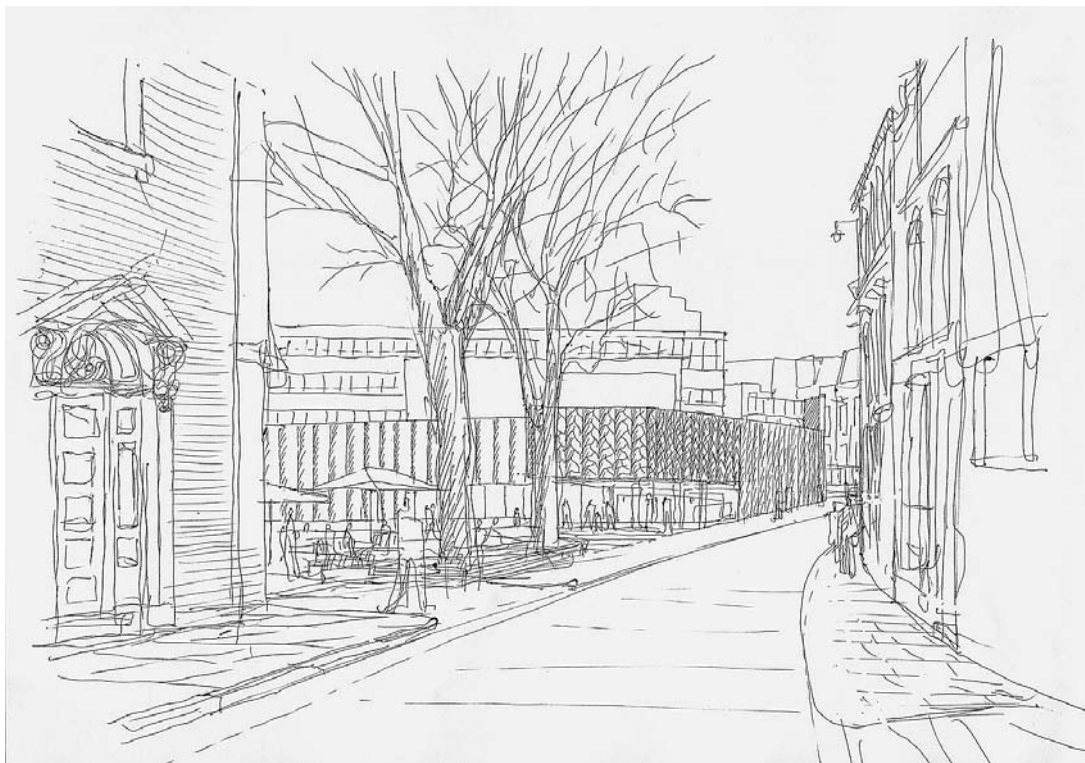
sl. 3. Crtež dijela grada gdje će biti smješten Centar © Courtesy Caruso St John Architects

Ujedinjenog Kraljevstva suvremenu umjetnost još uvijek doživljavaju kao strani jezik, poželjeli ponuditi nešto drukčije mogućnosti obrazovanja ljudima različitih životnih dobi i pomoći im da razviju vlastiti kreativni potencijal putem raznih organiziranih događanja, duljih gostovanja umjetnika, stipendija koje bismo nudili u suradnji sa sveučilištima, umjetničkom izobrazbom, stručnom potporom i sl.