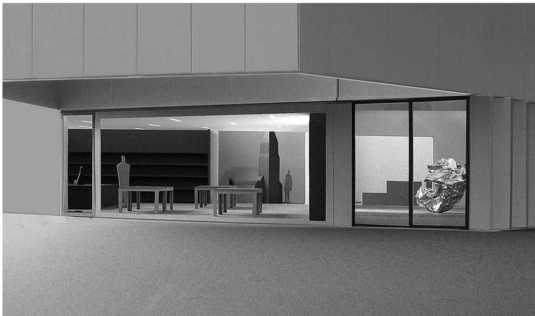
sl.7.-8. 3D simulacija jednog od izložbenih prostora Centra za suvremenu umjetnost (CCAN), Nottingham

Željela bih navesti i naše izvore financiranja – uobičajenu kombinaciju gradske vlasti, Vlade te europskih i umjetničkih vijeća. Naš će projekt stajati više od trinaest milijuna i bit će vrlo dugotrajan. Trenutačno na gradilištu obavljamo sve pripremne radove da bismo lokaciju osposobili za gradnju, a to, među ostalim, podrazumijeva i konstrukciju toplinskog voda koji bi grijao cijeli grad pa ćemo morati preusmjeriti cijev. Počet ćemo graditi nešto prije Božića 2006. i nadamo se gradnju dovršiti u proljeće 2008. Prema planu, zgrada bi se za javnost trebala otvoriti u jesen 2008. U to je doba godine noćni pogled na zgradu i grad prekrasan. Sada, dakle, moramo raditi na programima gradnje, ali i na preseljenju iz Galerije Angel Row, koja će se zatvoriti. Moramo također ustanoviti novu organizaciju i novi upravni odbor. To su naši planovi za budućnost.