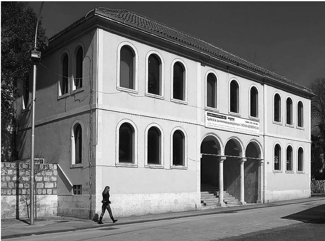
sl.1. Galerije umjetnina Split, u neposrednoj blizini Dioklecijanove palače

IM 37 (1-4) 2006. TEMA BROJA TOPIC OF THIS VOLUME