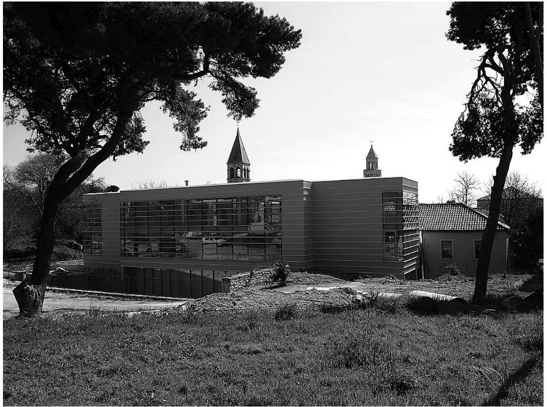
sl.5. Sadašnji izgled stare zgrade Umjetničke galerije