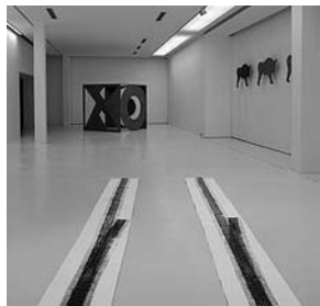
sl. 10. Izložba: Splitska suvremena umjetnost: nova generacija / rad Kristine Restović: Vozanje , 2006.