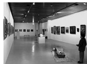
sl.13. Izložba: Enformel, 2001.