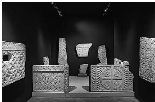
sl. 4. Muzej / Museo Lapidarium, Novigrad / Cittanova, stalni postav

Tehnički opis načina izlaganja. Način izlaganja (postavljanja) stalnog postava lapidarne zbirke zadovoljava uvjete sigurnosti i integriteta izložaka te relativno kvalitetnog razgledavanja i doživljaja. U tehničkom smislu svi izložci imaju jednaku ili sličnu fizičku strukturu. Riječ je o vapnenačkim ili mramornim artefaktima relativno velike tvrdoće. Svi su predmeti kompaktni, stoga su postavljeni slobodno, bez stakala ili drugih zaštitnih elemenata. Većina je izložaka postavljena na okomite plohe zida ili je obješena na konzole od nehrđajućeg čelika, uz dodatno osiguranje od pomicanja i prevrtanja. Dvije grupe spomenika postavljene su na specifičan način da bi došla do izražaja njihova izvorna funkcija. Tri pluteja oltarne pregrade ukrašena su plitkim reljefima s obje strane, a neki su obrađeni na proboj. Riječ je svjetski unikatnom primjeru perforiranog pluteja te je trebalo istaknuti to njegovo obilježje. Da bi se pokazao cijeli ukras, a ujedno upozorilo na njihovu izvornu funkciju