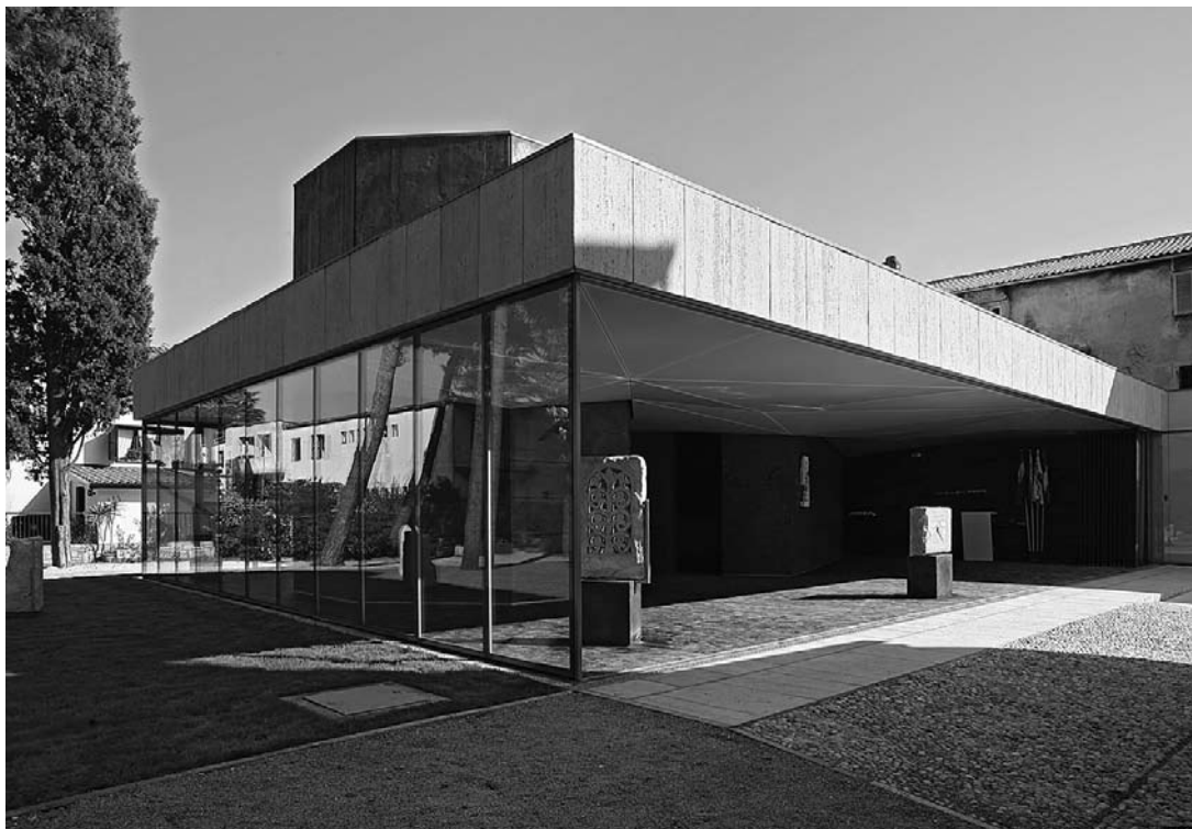
sl. 1. Muzej / Museo Lapidarium, Novigrad / Cittanova

IM 37 (1-4) 2006. IZ MUZEJSKE TEORIJE I PRAKSE MUSEUM THEORY AND PRACTICE