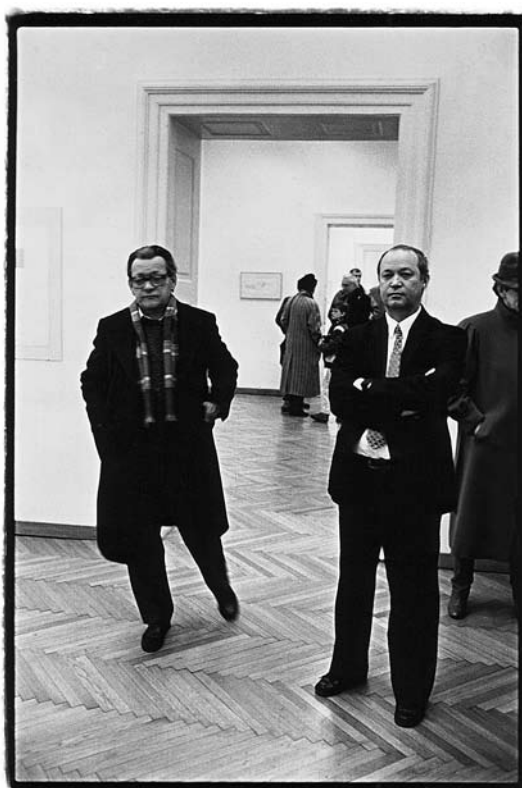
sl. 16. Otvorenje izložbe: Italija tridesetih godina , Umjetnički paviljon, 6. – 25. travnja 1989., snimio: Boris Cvjetanović