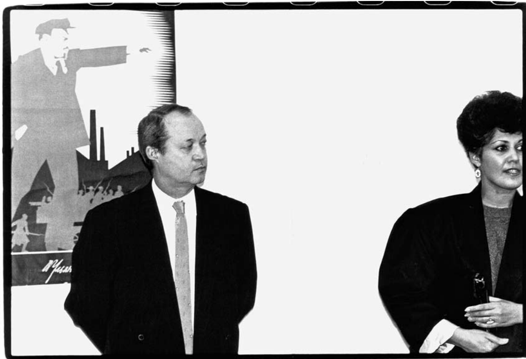
sl. 14. Otvorenje izložbe: Sovjetski plakat, 1918. – 1930. , Studio GSU, 25. listopada – 20. studenoga 1988.

koliko djela, kolika bi nam kvadratura bila potrebna za Nacionalni muzej suvremene umjetnosti gdje bi obje kuće bile pod istim krovom. Međutim, tada je došlo do razmimoilaženja jer Moderna galerija u svom sastavu ima i 19. stoljeće, i oni nisu bili za to da dođe do spajanja, jer se Galerija suvremene umjetnosti bavila mladim generacijama, inovacijama u suvremenoj umjetnosti i prikupljala takvu vrstu radova. Zatim, budući da smo u Kulmerovoj palači od 1954. godine, u koju zbog malih vrata nije moglo ući ništa što je bilo na blindrami većoj od 2 x 2 m. Moglo se unijeti samo nešto što je bilo u roli.