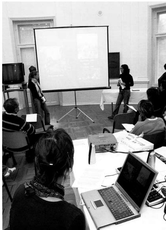
sl. 2. – 6. Detalji s prezentacije