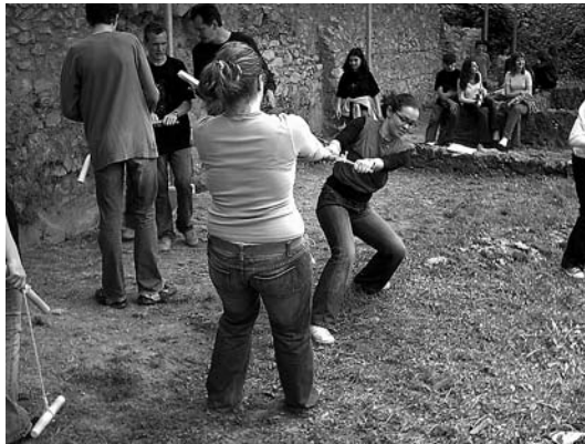
sl. 4. – 5. Detalj s igraonice igre ludus castellorum