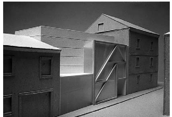
sl. 15. – 17. U susret novoj Galeriji Marina Cettine?

Fotografije arhitektonskih modela galerije koje su osmislili i izradili arhitekti Vinko Penezić i Krešimir Rogina, 1995. godine