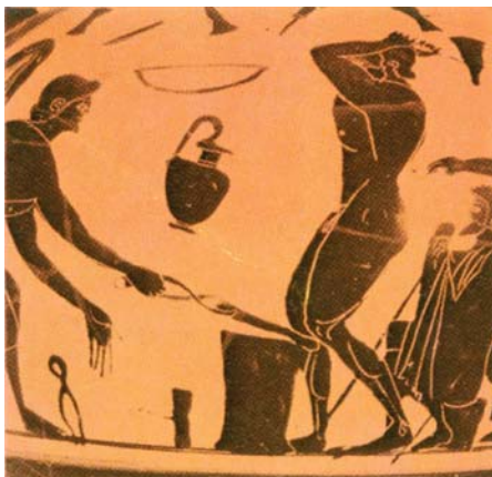
SLIKA 1. Grčki kovač prikazan na antičkoj vazi 1

Ljudi su relativno kasno upoznali željezo, a ono je obilježilo čitavo jedno razdoblje prethistorije koje je nazvano Željeznim dobom (1. tisućljeće pr. Kr.). O njemu pišu stari Grci (slika 1) (povjesničar Hesiod, Homer u Ilijadi, Aristotel spominje meko i tvrdo željezo) i Rimljani, no oni su ga upoznali iz Azije. Kinezi su bili prvi koji su ga znali dobiti iz rudače.