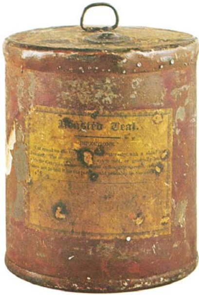
SLIKA 2. Limenke (Donkin, Hall & Gamble) s pečenim mesom, 1824. 1

Limenke za aerosole upotrijebljene su prvi puta početkom 20. stoljeća u Norveškoj, no masovno se rabe nakon Drugoga svjetskog rata. Procjenjuje se da se godišnje proizvede 12 milijarda boca za aerosol. U njima se kao raspršivači više ne rabe klorfluorugljikovodici koji pridonose nestanku ozonskoga sloja već manje štetni spojevi.