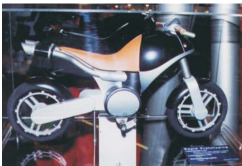
SLIKA 1. Primjeri prototipova

Osim spomenutoga, na izložbi su bila predstavljena mnoga suvremena konstrukcijska pomagala koja pomažu alatničarima odgovoriti na nove izazove kao što su (i) zahtijevane niže cijene kalupa, (ii) kraće vrijeme izrade, (iii) primjena novih materijala, (iv) razvoj novih postupaka izradbe polimernih proizvoda kao i (v) sve uža tolerancijska polja. Iz područja prethodne i završne obradbe najvažnije je spomenuti peteroosne obradne centre koji omogućuje obradbu složenih proizvoda s malim brojem stezanja (slika 2).