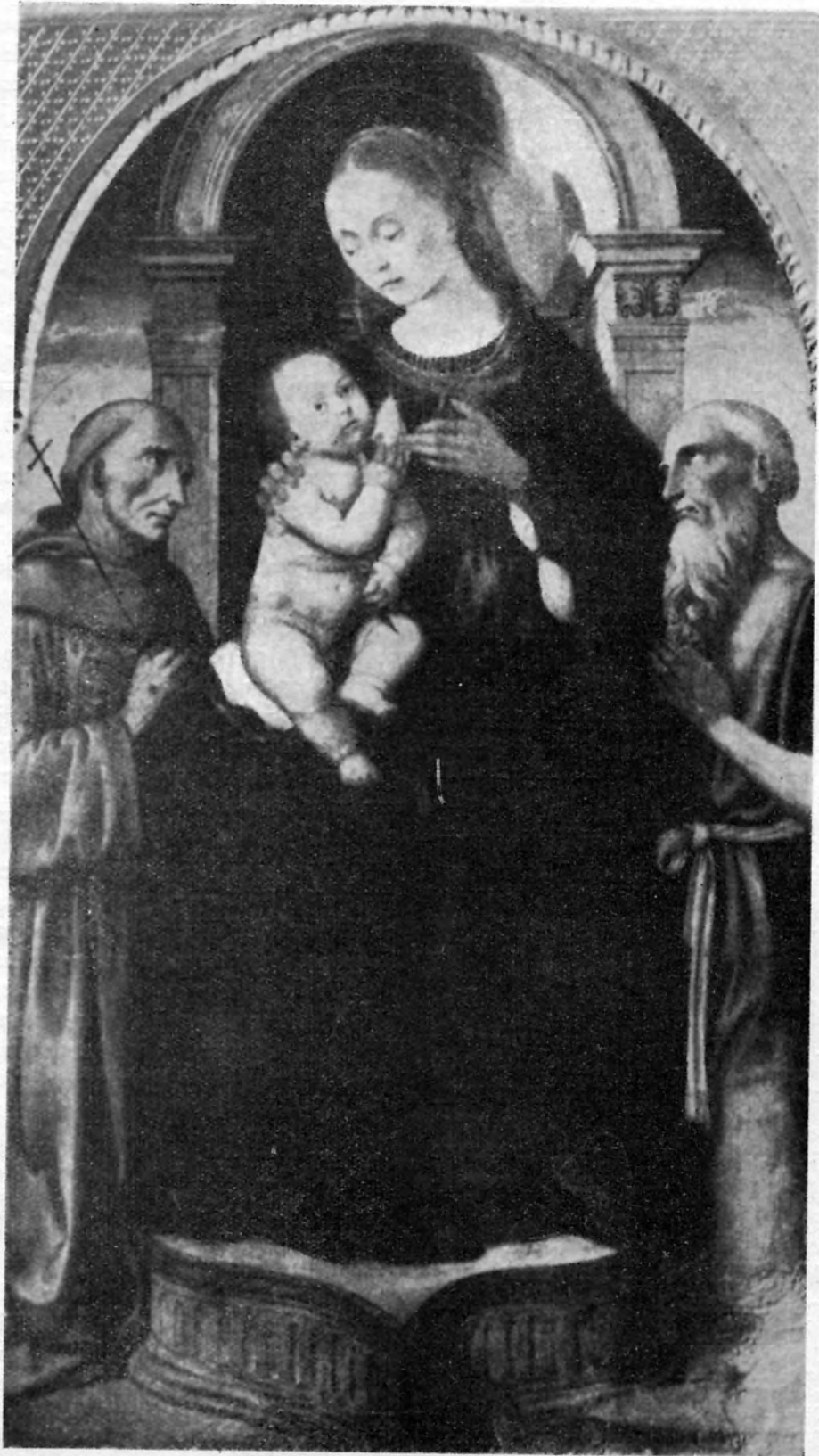
Sl. 5 — Biagio d'Antonio: Madona s Isusom (Strossmayerova galerija, Zagreb)