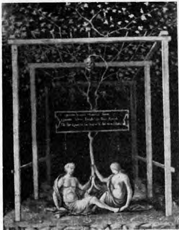
Sl. 10 — »Alegorija«, na stražnjoj strani slike A. Solarija 4 (Strossmayerova galerija, Zagreb)

uzeli još neki pisci 2 . Veliki fresko-ciklus u t. zv. »Atrio del Platano« bio je po svoj prilici zamišljen od jednog umjetnika, i to očito Venecijanca, premda izvedba odaje nekoliko različitih ruku. Prve tri su stilski jedinstvene i najbolje, te očigledno pripadaju samom majstoru, no kako se drugdje nije moglo naći dovoljno uvjerljivih kongruenca, ostao je nepoznat i neproučen sve do našeg vijeka. Napisane su doduše u 19. vijeku o njemu dvije male biografije, 3 a ni Frizzoni nije sumnjao u njegovo postojanje. 4 Bilo je, naime, poznato, da u Petrogradu, u zbirci Leuchtenberg, postoji njegova slika »Bogorodica s Isusom i sv. Ivanom« potpisana Antonius de Solario Venetus , a to je upravo slika, koju je Moschini poznavao dok je još bila u Veneciji kod opata Celottija i publicirao u citiranoj monografiji. Pa ipak, kad je Roger Fry u Burlington Magazineu 1903. objavio tu sliku (tada već u posjedu