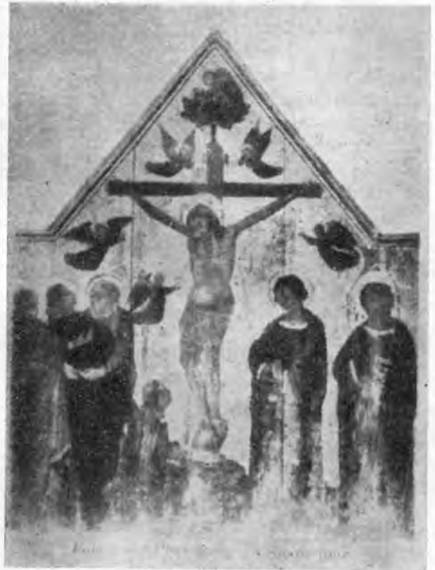
Sl. 4 — Škola ankonitanske marke: Raspeće (Pinacoteca, Fabriano)

Još nekoliko problema ostalo je do danas otvoreno, možda upravo zbog osrednjih vrijednosti slika, koje ih svojom labilnom stilistikom postavljaju. Oznakom »škole Sandra Botticellija« označio je, sasvim razumljivo, Van Marle sliku »Bogorodica s Isusom« (br. 22, sada u depozitu), a smjeru Lorenza di Credija pripisana je već od Frizzonija ona »Bogorodica s djetetom«, koja u našoj galeriji mekoćom modelacije i izraza izdaleka aludira na maniru Leonarda. Vrlo se neodlučno izjasnio Berenson za Ridolfa Ghirlandaia u pogledu »Bogorodice s Isusom i malim Ivanom«, i to s napomenom, da je njegovo rano djelo. Svojim stilom ona je (ako zaista pripada ovom slikaru, koji je živio od 1483—1561) zaista mogla nastati samo u najranijem razdoblju