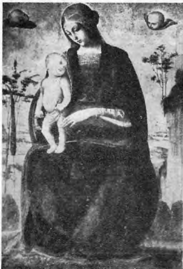
Sl. 1 — Eusebio di San Giorgio: Bogorodica s Isusom (Strossmayerova galerija, Zagreb)

slikara. I »Bogorodica s Isusom i svecima« Bartolomea Caporalija i »Bogorodica s Isusom« zakašnjelog quattrocentiste Eusebija di San Giorgio imaju tako određenu i jasnu stilistiku, tako da je svaka sumnja isključena, a njihove karakteristike točno određuju likovnu situaciju na početku i na kraju kratkotrajnog razvitka umbrijske škole: kod Caporalija jasan utjecaj Gozzolija i apsolutna sinteza Firenze i najranije Umbrije u liku Madone i minijaturnoj ljepoti anđela; kod Eusebija kompaktna peruginovska masa Djevice, ali obrubljena linijom, rekli bismo, kasnogotičke finoće; uokolo umbrijski pejzaž s gracilnim drvećem i dalekim vidikom. (Zanimljivo je spomenuti, da se ista glava Bogorodice i slična grimasa na licu djeteta može vidjeti na neatribuiranom tondu »Madone s Isusom i dva anđela« u galeriji Ca'd'oro u Veneciji.)