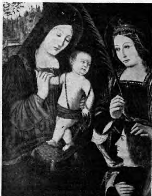
Sl. 9 — Antonio Solario: Sv. Katarina preporučuje donatora Bogorodici (Strossmayerova galerija, Zagreb)

Ustvari, u lokalnom napuljskom krugu, likovna egzistencija ovog slikara bila je dapače i hipertrofirana: pripisivana su mu djela, koja je moderna nauka najčešće prepoznala kao djela sasvim drugih umjetnika. To, pa pometnja, koju je polovinom 18. vijeka izazvao Bernardo Dominici ( Vite de' Pittori napoletani , 1742.) proglašivši da je Antonio rodnom iz Abruzza, što je kasnije prihvatio i Lanzi ( Storia pittorica , 1809.), doprinijelo je nepovjerenju, koje je prema ovoj zagonetnoj, gotovo hipotetičnoj ličnosti tako dugo vladalo. A ipak, jedan literarni izvor je postojao, makar iz mnogo kasnijeg vremena: u svojoj » Napoli sacra « Cesare D'Eugenio je 1624. zapisao, da je freske u samostanu SS. Severino e Sosio u Napulju izradio Antonio Solario, » singolar pittore veneziano, per soprannome detto lo Zingaro «. To su kasnije pre-