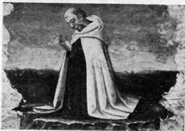
Sl. 8 — Neri di Bicci: Redovnik (Samostan S. Maria a Morocco, Tavarnelle, Val di Pesa).

Male slike iz naše galerije izrezani su fragmenti jedne predele, u sredini koje se vjerojatno također nalazio Krist u grobu. Sami likovi nisu osobito zanimljivi i mogu se češće sresti na slikama Neri di Biccija, na spomenutoj slici iz firentinske Akademije, na primjer. Ali jedna od naših slika, ona sa sv. Franjom ima ipak nešto, što nisam