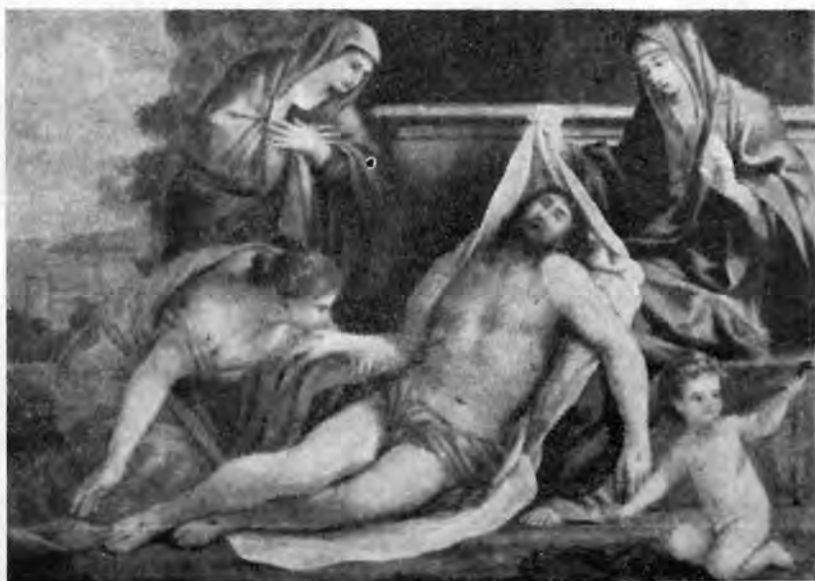
Sl. 13 — Giovanni Francesco Romanelli: Oplakivanje Krista (Strossmayerova galerija, Zagreb)

Barberini, no upravo na tom poslu došlo je među njima do raskida. Kako je već bio stekao naklonost kardinala Francesca Barberinija i Lorenza Berninija, postao je uskoro jedan od najviše zaposlenih slikara u Rimu. Sa 25 ili 26 godina (1656-57) izradio je jednu sopraportu za baziliku sv. Petra, a zatim fresko dekoraciju u t. zv. sali kontese Matilde u Vatikanu (1637-42) i t. d. Ugled, koji je ovaj slikar u svoje doba uživao možemo najbolje uočiti po njegovim odlascima u Pariz i radu na najznačajnijim dekoracijama tog vremena. Put je uslijedio 1646-47, kad je za kardinala Mazarina izradio u njegovoj palači (sada Bibliothèque nationale ) dekoraciju galerije,