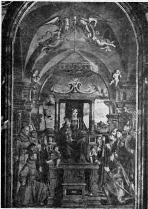
Sl. 12 — Antonio Solario: Madona sa svecima (Crkva del Carmine, Fermo)

način kako ženske figure s desne strane prijestolja na pali u Fermu, kao i na onoj u Osimu, drže križ, odnosno palmu. Ne bih rekao, da se ruke a i gesta, kojom drži palmu i naša sv. Katarina, mnogo ne razlikuju od ruke svetice u Fermu. Modigliani je za istu atribuciju upotrebio i karakteristično produženje ušne šupljine prema dolje, kakvo se može zapaziti na nekim licima u Osimu i u Fermu. Upravo to isto nalazimo i na ušnoj školjci malog Isusa u Zagrebu.