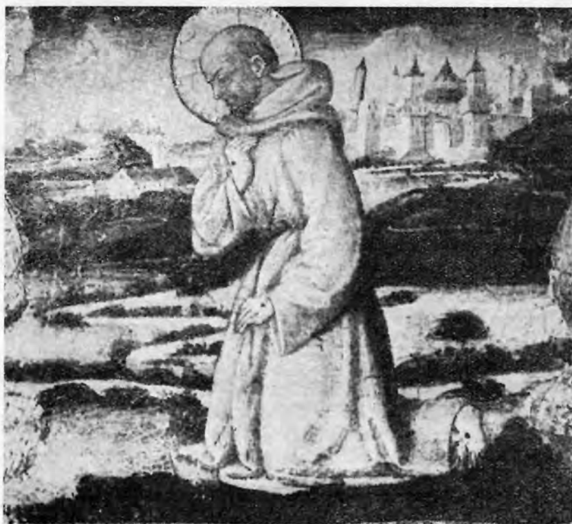
Sl. 7 — Neri di Bicci: Sv. Martin (Strossmayerova galerija, Zagreb)

mogao zapaziti ni na jednoj predeli ovog slikara. To je vrlo lijep i relativno bogat pejzaž u pozadini. On se u prednjem planu produbljuje stazom, koja vijuga dolinom slikanom smeđom bojom. Lijevo u dnu je crkva sa zvonikom. Iza nje u pozadini nižu se zelenkastoplavi brežuljci, koji se stapaju s nebom; na njima se vide gradovi i kule. No glavna tema ove lijepe pozadine je grad na desnoj strani. Slikan je bjelkastom bojom s lakim ružičastim sjenama, dok su krovovi tornjeva i kuća zelenkastoplavi. Cjelina je dana vrlo homogeno kao lijepa mala priča.