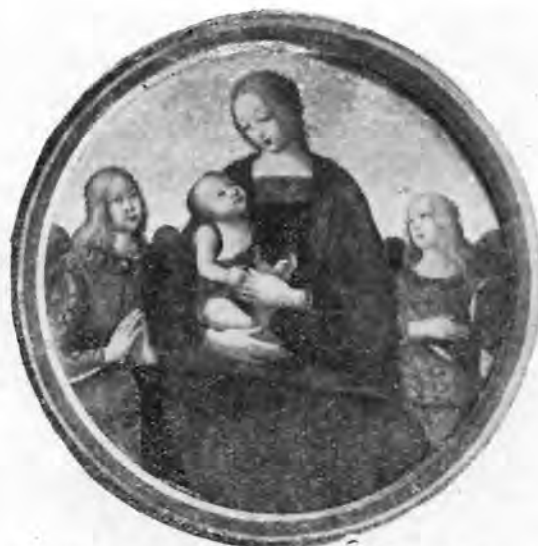
Sl. 2 — Umbrijska škola: Madona s Isusom i dva anđela (Ca d'oro, Venecija)

biti zanimljivo napomenuti, da sam isti taj pejzaž s gradom i tornjevima vidio na freski Vizitacije u S. Maria Novella u Firenzi, u koru, na kome je, kao što je poznato, radila cijela radionica Ghirlandaia, pa prema tome i Bastiano Mainardi.