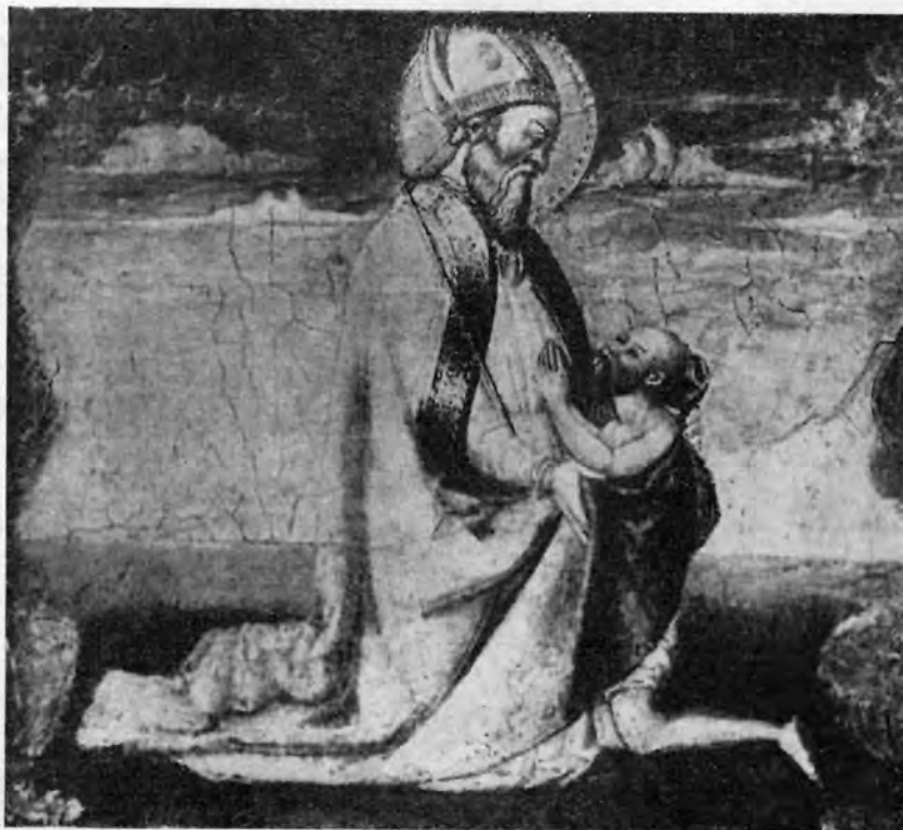
Sl. 6 — Neri di Bicci: Sv. Franjo Asiški (Strossmayerova galerija Zagreb)