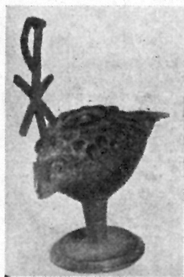
Sl. 1-3 — Lampica u obliku janjeta sa Kristovim monogramom (lijevo — u poluprofilu; desno — gledana odozgo.)

Mjere: cijela vis. lampice 0,094 m; vis monograma 0,046 m; vis. nožice 0,027 m; duljina lampice 0,095 m; promjer baze 0,035 m.