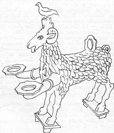
Sl. 5 — Zoomorfna lampica