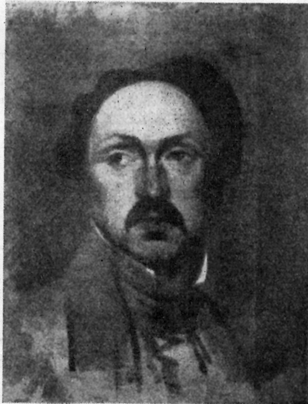
Sl. 1 — Dimitrije Avramović: Portret muškarca