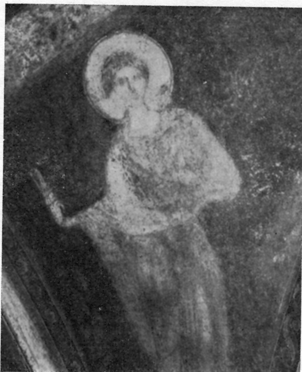
Sakristija katedrale — Detalj freske

Iz tih uzroka nisu ta trula mjesta čišćena kruhom, jer bi trljanjem otpala ne samo boja, već i dobar dio žbuke. Ti su dijelovi slikarija samo učvršćeni (ukoliko se to može) tako, da su u više navrata poprskani vapnenom vodom i kazeinom.