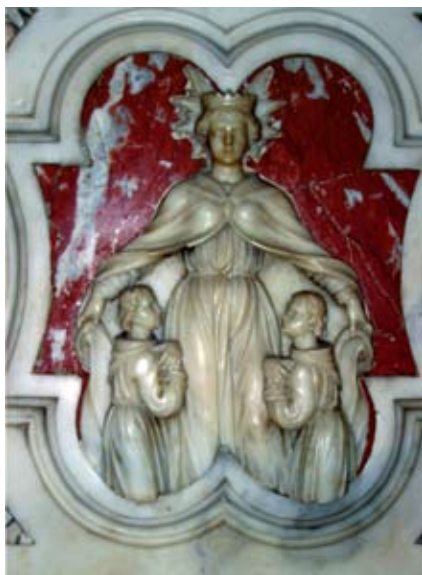
Slika 5a. Šibenik, Nova crkva, Bogorodica zaštitnica na stipesu glavnog oltara