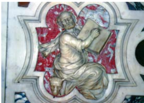
Slika 5b. Šibenik, Nova crkva, Sv. Marko Evanđelist na stipesu glavnog oltara →