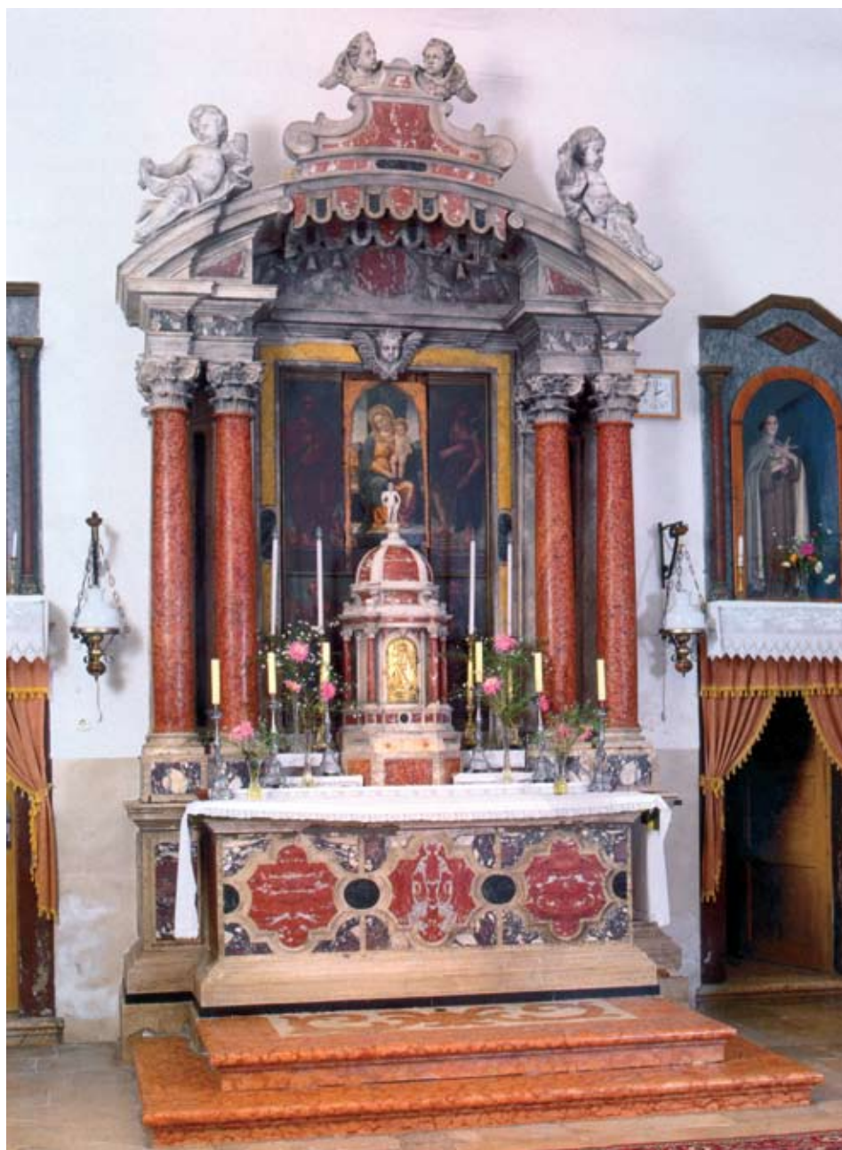
Slika 2. Marko Torresini, Glavni oltar, Ždrelac, župna crkva sv. Marka