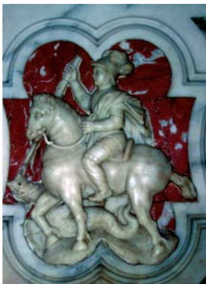
Slika 5c. Šibenik, Nova crkva, Sv. Juraj na stipesu glavnog oltara