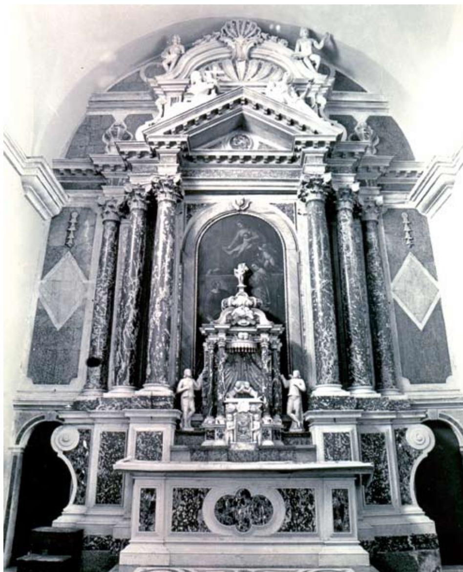
Slika 7. Glavni oltar, župna crkva Gospe od Karmela Nerežišća (otok Brač)