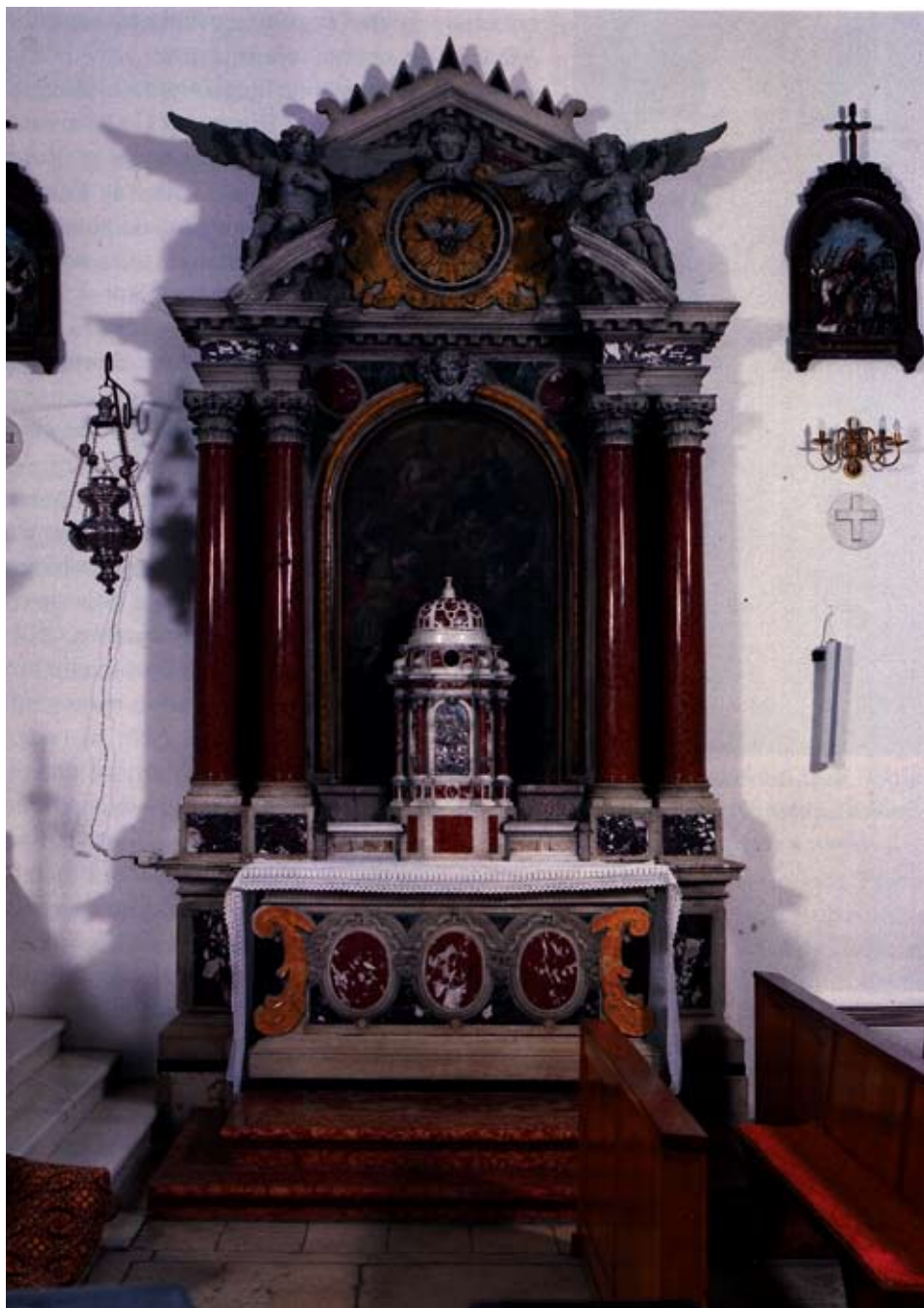
Slika 1. Marko Torresini, Bočni oltar, Kali (otok Ugljan), župna crkva