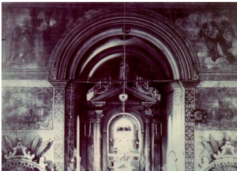
Slika 5. Marko Torresini, Glavni oltar (uklonjen), Nova crkva Šibenik