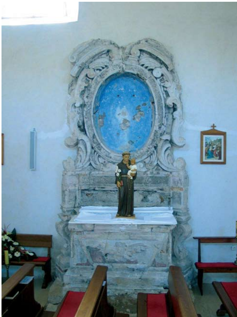
Slika 4. Marko Torresini, Bočni oltar, Obrovac, župna crkva crkva sv. Josipa (prije Zadar)