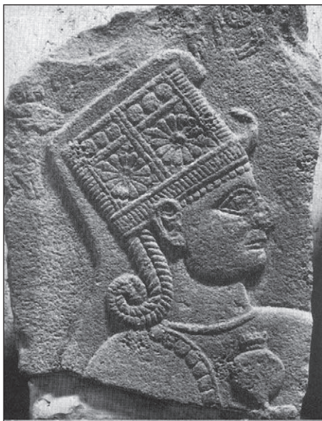
Slika 2: Kubaba iz Karkemiša, Muzej anatolskih civilizacija u Ankari (Vermaseren 1977, fig. 7)