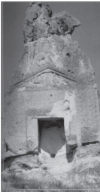
Slika 5: Spomenik u Arslankaji (Roller 1999, 87, fig. 19)