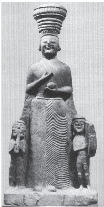
Slika 3: Kibela iz Boğazköya, Muzej anatolskih civilizacija u Ankari (Vermaseren 1977, fig. 10)