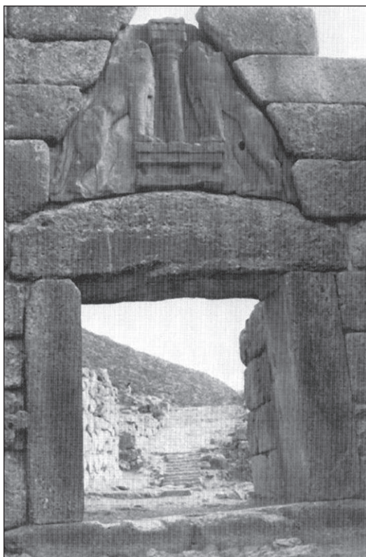
Slika 7: Lavlja vrata u Mikeni (Vermaseren 1977, fig. 3)