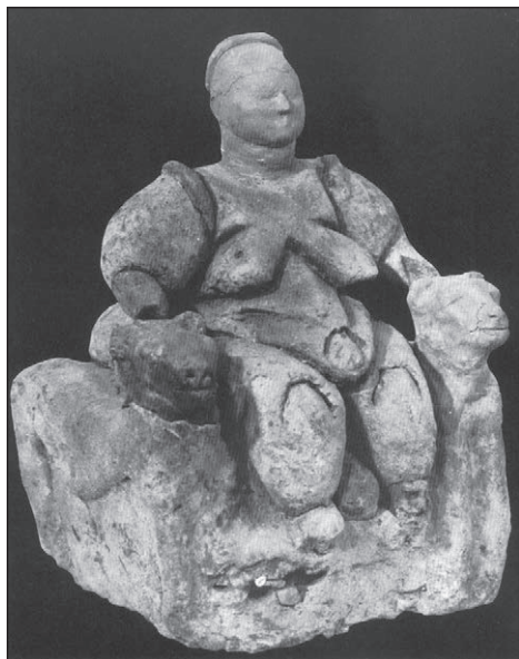
Slika 1: Božica iz Çatal Hüyük, Muzej anatolskih civilizacija u Ankari (Vermaseren 1977, fig. 5)

se, kastrirao. Iz krvi je izraslo cvijeće, a njegovo se beživotno tijelo pretvorilo u bor. 33 Etiologiju mita prepoznamo u ritualnoj praksi gala, Kibelinih svećenika koji su se u ekstatičkom zanosu kastrirali. Smatra se da je ta praksa postojala još u frigijsko doba, o čemu bi svjedočila srebrna skulptura golobradog svećenika iz Bajandira (Muzej u Antaliji). Svakako, frigijski kult Kibebe prihvaćen je i modificiran u grčkom i rimskom svijetu te je opstao sve do prevlasti kršćanstva nad poganskim religijama.