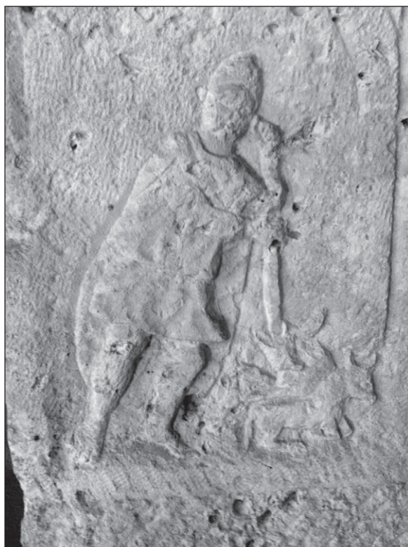
Slika 8: Dio sarkofaga s likom tužnog Istočnjaka, Salona, Arheološki muzej u Splitu