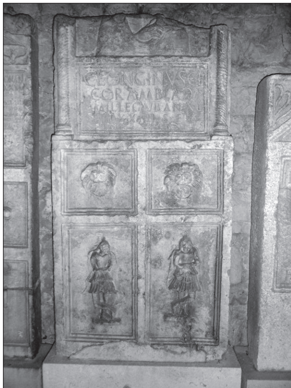
Slika 1: Vojnička nadgrobna stela, Tiliurij, Arheološki muzej u Splitu