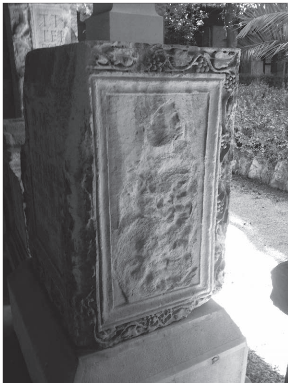
Slika 5: Bočna strana žrtvenika, Salona, Arheološki muzej u Splitu