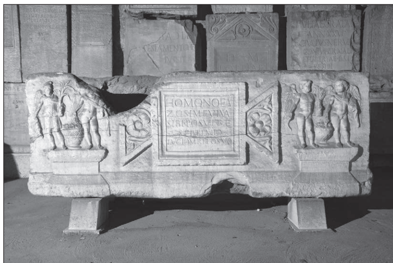
Slika 6: Sarkofag s prikazima personifikacija godišnjih doba, Salona, Arheološki muzej u Splitu