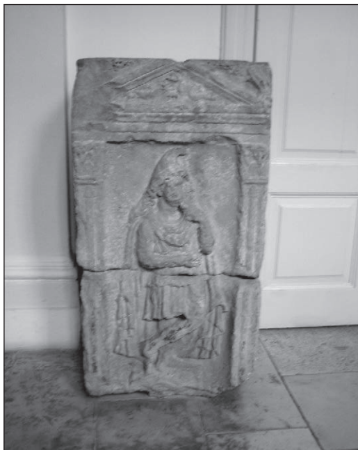
Slika 3: Ortostat grobnice, Pola, Arheološki muzej Istre u Puli