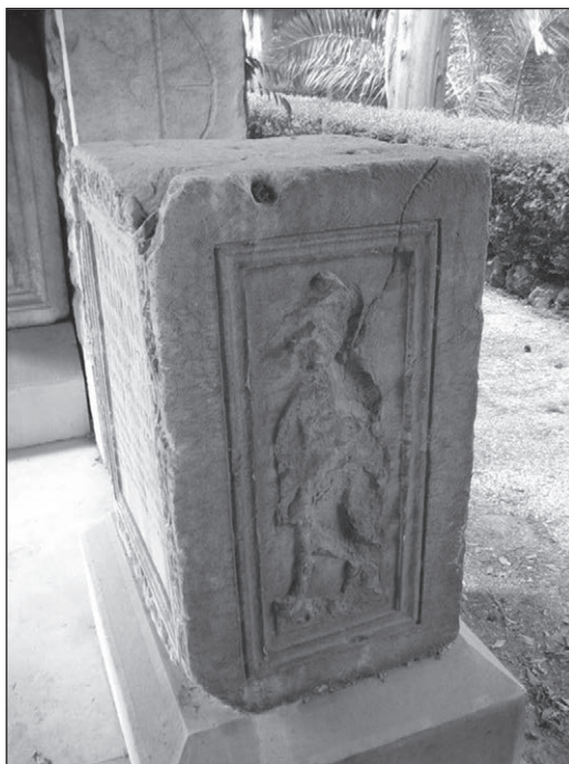
Slika 4: Bočna strana žrtvenika, Salona, Arheološki muzej u Splitu