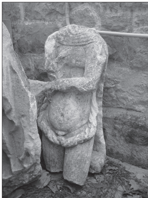
Slika 9: Atis, Salona, Arheološki muzej u Splitu