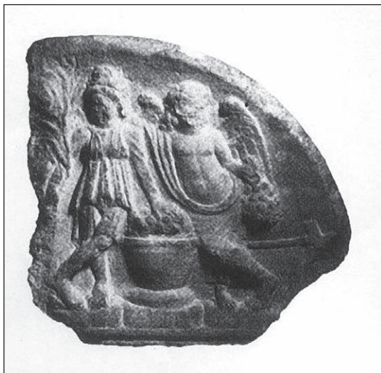
Slika 7: Akroterij sarkofaga, Salona, Arheološki muzej u Splitu (Cambi 2002: 157, sl. 256)