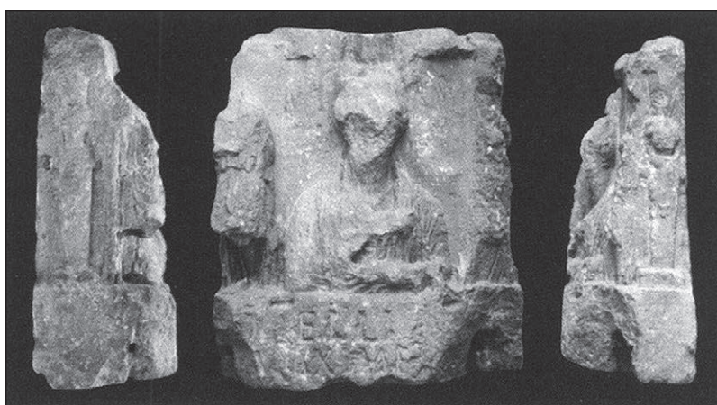
Slika 2: Stela Obelije Maksime, Pola, Arheološki muzej Istre u Puli