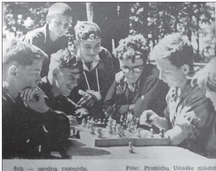
Slika 3. Šah i mladež

jednoga užeg kruga, na pr. srednjoškolske mladeži. On mora da postane baštinom kako onih, koji se bave intelektualnim radom, tako i onih na koje je da s rukama punim žuljeva i fizičkom snagom rade za dobro čitavog naroda. Svi oni moraju se koristiti odlikama i vrlinama, koje ta plemenita igra budi kod mladeži“. 80