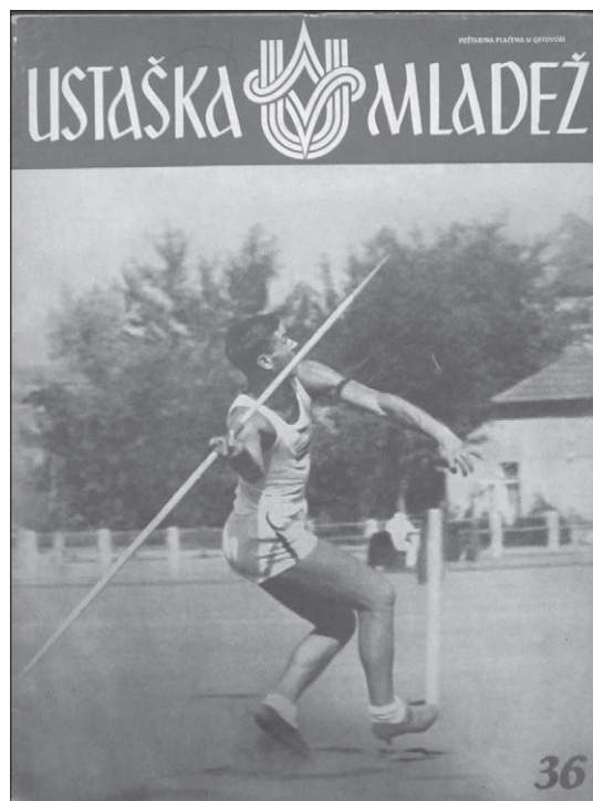
Slika 2. Atletika i mladež

Broda. 64 Također, atletska natjecanja održavala su se i na državnome nivou. Tako je primjerice 29. i 30. kolovoza 1942. godine na igralištu sportskoga kluba Concordija održano državno prvenstvo Ustaške mladeži u atletici. Prema novinskome izvještaju, natjecanju su prisustvovali predstavnici stožera Hum, Dubrava, Bilogora, Baranja, Livac-Zapolja, Modruš, Prigorje, Pokupje, Vuka I., Vuka II., Zagreb I., Zagreb II. i Zagorje. Samu svrhu i cilj ovoga natjecanja najbolje je opisao sam autor kada je naveo da „Ovim velebnim i viteškim takmičenjem pokazala je mladež nove Hrvatske, da želi izbrisati i posljednje tragove nekadašnjeg materijalističkog i trgovačkog duha, koji je vladao u životu pa i u športu. Divnom, viteškom borbom, mladež koja je izgrađena i koja se izgrađuje po načelima ustaškog pokreta, pokazala je, da joj nije mnogo stalo do lažnih i nečasnih rekorda, nego potpunom svijesti, stegom i spremom želi pokazati svim onim skepticima da se izgrađujemo na jakim i moralnim životnim temeljima“. 65