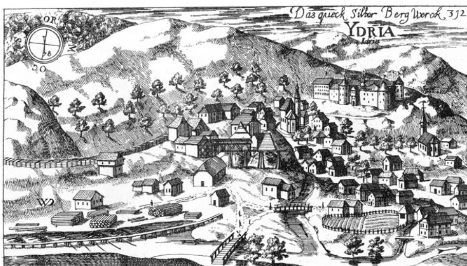
Slika 3. Idrija po Valvasorjevi Topografiji Kranjske leta 1679 (VALVASOR, Topographia , št. 312)

srebra je deloval od konca 15. stoletja in postal, potem ko je leta 1575 v celoti prešel v deželnoknežje roke, drugi največji na svetu. 20 Idrija je kot samostojno gospostvo pod vodstvom rudniške uprave v upravno-političnem pogledu dolgo spadala neposredno pod organe dvorne komore in je del Kranjske dokončno postala šele leta 1783. 21 Zaradi pomena in velikosti so jo nekateri vsaj od konca 17. stoletja šteli za trg, 22 v drugi polovici 18. stoletja pa je, najbrž brez formalnega akta, uradno postala mesto oziroma rudarsko mesto (Bergstadt). Vprašanje, kdaj in kako se je to zgodilo, še ni raziskano. 23 Jožefinski vojaški zemljevid iz srede osemdesetih let 18. stoletja Idrijo v opisnem delu naslavlja kot »Bergstadt« 24 in enako uradni seznam mest in trgov na Kranjskem iz leta 1795. 25 Istege leta je na Kindermannovem zemljevidu Postojnskega okrožja uvrščena med mesta (Stadt), 26 kot mesto pa je obravnavana tudi v uradnih popisih naselij iz prve polovice 19. stoletja. 27 Mestni naslov je kontinuirano obdržala v 20. stoletje in ga ima tudi danes.