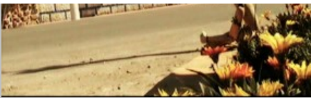
Katarina Arbanas: Jan putuje Produkcija eNtity Premijera 20. studenog 2014. Fotografije: Katarina Arbanas | Ognjen Jovanović

pripada, iako nigdje izričito definirana. Neposrednost reakcija ljudi i pokoje životinje na začudni animacijski minimalizam, snimane uglavnom u formi dokumentarnog zapisa, komuniciraju o prikladnosti lutke kao nositelja radnje. Bi li glumac mogao, izvedeći simplificirane Janove postupke okupirati toliku pažnju i prouzročiti jednaku reakcijsku neposrednost okoline, kada bi ti isti postupci u identičnim situacijama bili igrani? Teško. Kasnije dodanim scenarijskim postupkom stvara se