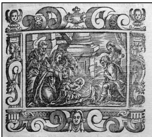
Slika 2 – Catechismus ex decreto Concilii Tridentini ad parochos, Venetiis, 1588. – Rodenje Kristovo – grafika – detalj (Klanjec: RIV-m8-5)