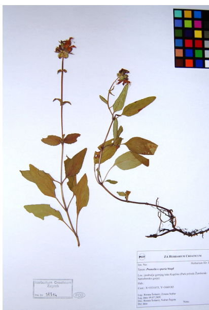
Slika 3. Prunella x spuria - herbarijski primjerak sabran na Žumberačkoj gori, područje gornjeg toka Kupčine (leg. R. Šošćarić i Z. Sedlar, dta. 9.7.2009., ZA, ID: 38714).