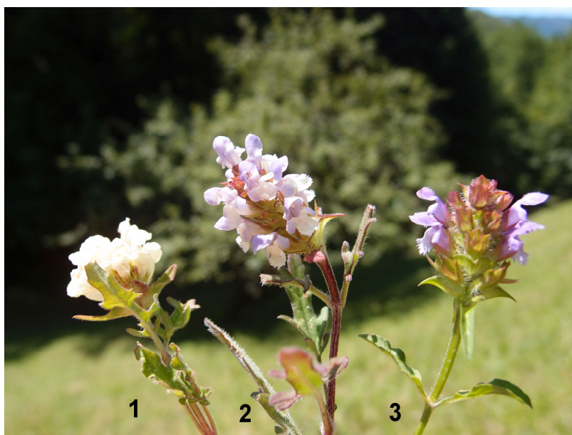
Slika 1. 1/ Prunella laciniata , 2/ P. x intermedia , 3/ P. vulgaris (Brezova gora).