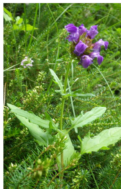
Slika 2. Prunella x dissecta - Žumberačka gora, na putu od sela Stari grad (Kekić draga) prema ostacima utvrde Stari grad Žumberak.