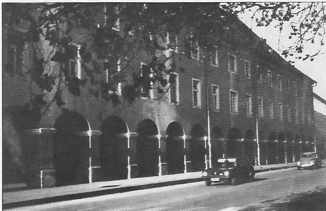
Zgrada vojarne Preradovića "Comando haus" križevačke regimente, građena 1756-1765. g. (Dom JNA, Trg jedinstva 2)

-kosturnica palih boraca u Bačkovici, Severinu, Markovcu, Bulincu, Drljanovcu, Gornjim Sredicama, Gornjem Križu, Jabučeti, Jakopovcu Kapelskom, Kapeli, Novoj Rači, Tvrdj Rijeki, Zrinskom Topolovcu i Višnjevcu. Gotovo u svim mjestima Općine postoje spomen-ploče i spomenici palim borcima i žrtvama fašističkog terora. Institucije koje djeluju u kulturi su: Muzej, Narodna knjižnica P. Preradovića, Historijski arhiv, Radničko sveučilište "P. Biškup-Veno", Informativni centar i Omladinski dom "Sedam sekretara SKOJ-a". 3