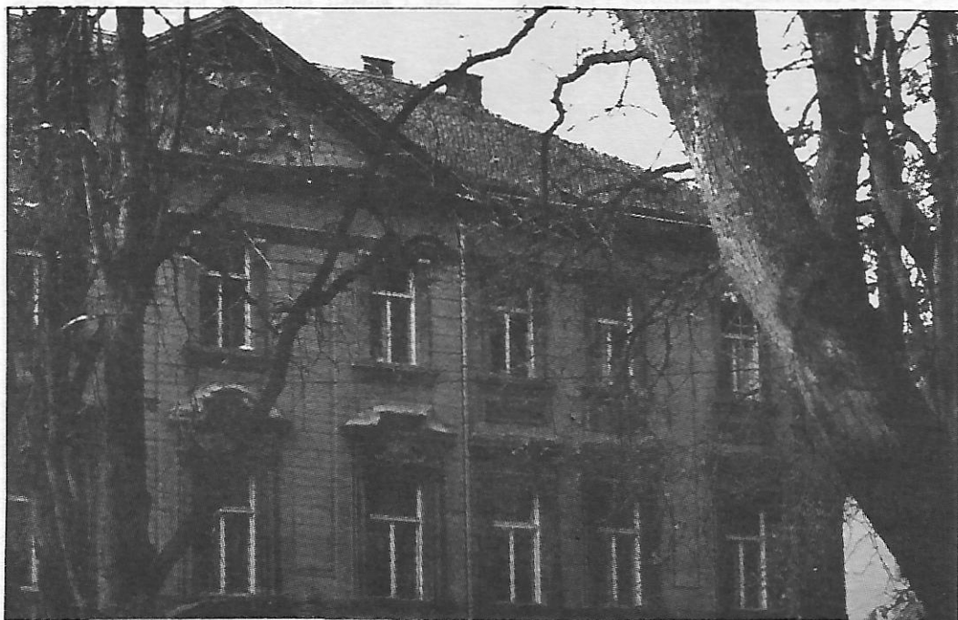
Stan generala, a kasnije sjedište županije (Trg jedinstva 7)

Do ukidanja Vojne krajine 1871. g. Bjelovar se razvio u jedan od najznačajnijih gradskih središtva sjeverozapadne Hrvatske. Od te godine na području Krajine uvedena je građanska uprava. 5