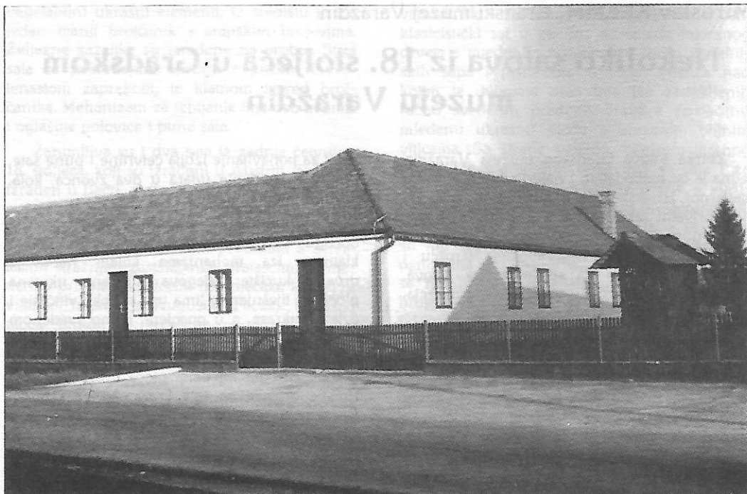
Spomen-muzej "Josip Broz Tito" u Velikom Trojstvu

U Bjelovarskom okrugu u toku rata od neprijateljskog terora izgubilo je živote 4.250 građana, a u jedinicama NOV iz bjelovarskog okruga poginulo je 2.410 boraca. 10