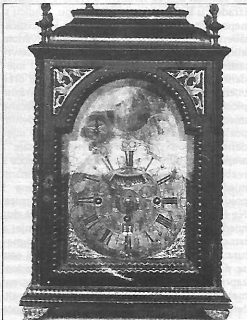
Tabernakl sat, Beč (Austrija), Augustin PECKEL, II pol. 18. st.