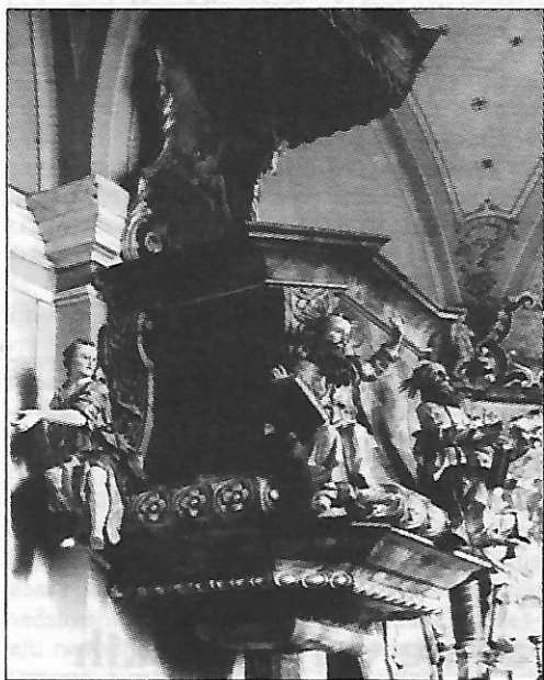
Sl. 3 - Križevci: kapela sv. Ladislava (propovjedaonica) 1969. godine

Usljed intenzivnog prometa, koji se odvija uz kapelu, popucali su noseći zidovi. Prošlo je već više godina otkako je započela akcija za obnovu ovog spomenika (u tu svrhu Skupština općine Križevci izdvojila je namjenska sredstva). Naručeni projekat sanacije i statičkog proračuna za ovu kapelu očekivano se još u svibnju 1986. g. Nažalost, radovi na zaštiti ovog spomenika nisu uslijedili tokom 1987. niti 1988. g.