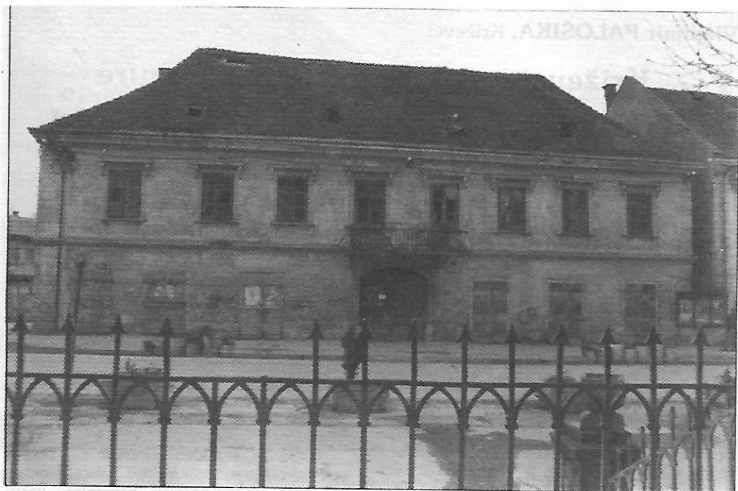
Sl. 1 - Križevci: kuća u ulici M. Pijade 4 prije rušenja 1985. godine