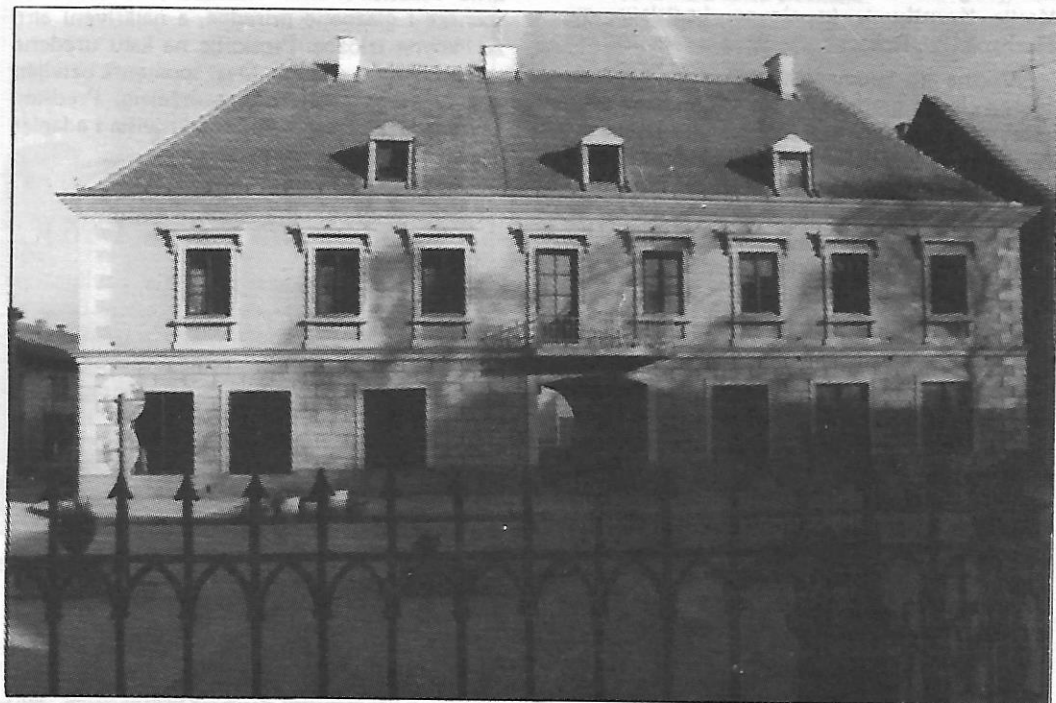
Sl. 2 - Križevci: kuća u ulici M. Pijade 4 nakon izgradnje 1988. godine