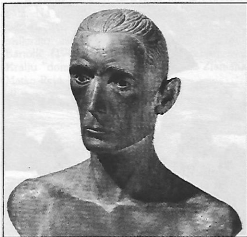
Martin Hegedušić: Autoportret, drvo, 1959.

nemušti likovni jezik pred samoga autora stavlja čitavu barijeru nerješivih problema. Ipak, iza njih, u gesti, pozi i izrazu već je donekle moguće nazrijeti precizno analitičko oko i težnju za potpunim, suštinskim doživljavanjem stvarnosti i njezinom interpretacijom.