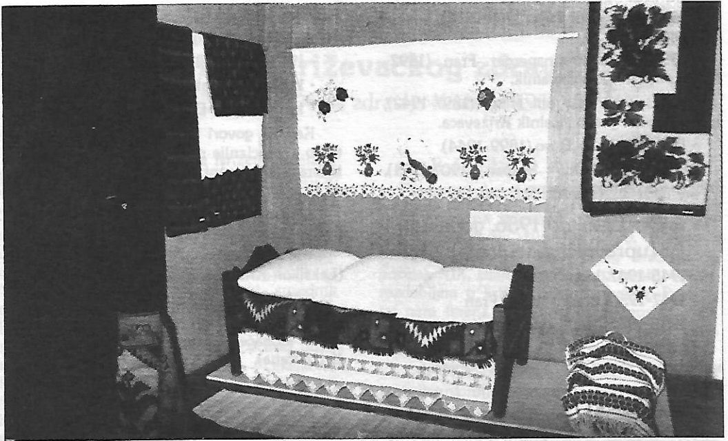
Sl. 1 - Slaganje postelje u sjeveroistočnom dijelu Moslavine