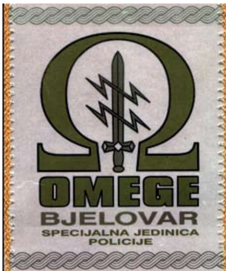
Slika 1. Grb Posebne jedinice policije Policijske uprave Bjelovar