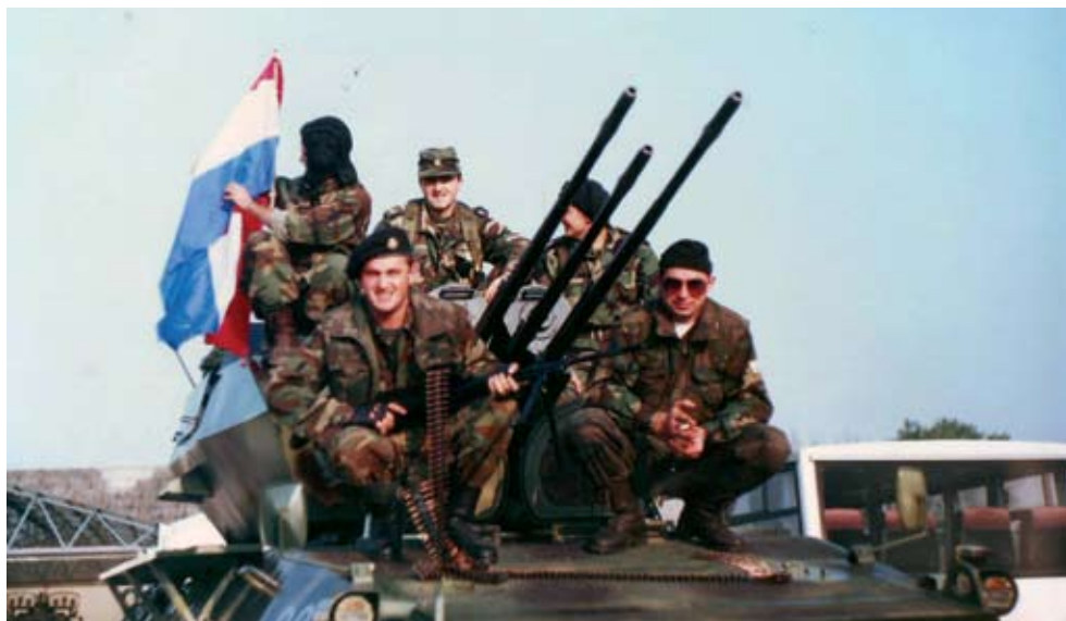
Slika 5. Iz vojarne Polom u Doljanima izvučen je bogat ratni plijen u oružju

Ivanovo Selo. 153 U oslobađanju je sudjelovalo i 70 pripadnika Omega . Nakon dolaska pred Ivanovo Selo angažirana je minobacačka bitnica sa 120-milimetarskim minobacačima pod zapovjedništvom Josipa Trogrlića i VSG-a Alena Novakovića te 82-milimetarskim minobacačima pod zapovjedništvom pomoćnika zapovjednika Damira Lauša i VSG-a Žarka Čanađije, koja je djelovala iz sela Poljani po okolnim okupiranim selima. Borbeno su djelovala i dva netrzajna topa (NTT)-a kojima su zapovijedali Nedjeljko Ambrošić i Damir Petrović. Od jačine eksplozija ozlijeđen je zapovjednik voda Ivica Jurenec, kojem su popucali ušni bubnjići. 154 Sutradan, 22. rujna, združene policijsko-gardijske snage čistile su šire područje Ivanova Sela. Bitnica Omega , ojačana minobacačkom grupom i 60-milimetarskim minobacačima, kojom je zapovijedao zapovjednik voda Ivan Franjić, premještena je u Donju Rašenicu, dok je ostatak Omega raspoređen na crte obrane Grubišnog Polja prema Peratovici. Tijekom dana ispaljen je velik broj projektila po okupiranim selima iz kojih je prethodni dan napadnuto Ivanovo Selo. Nastojeći pomoći pobunjenicima, zrakoplovi Jugoslavenske narodne armije taj su dan bombardirali Grubišno Polje. 155