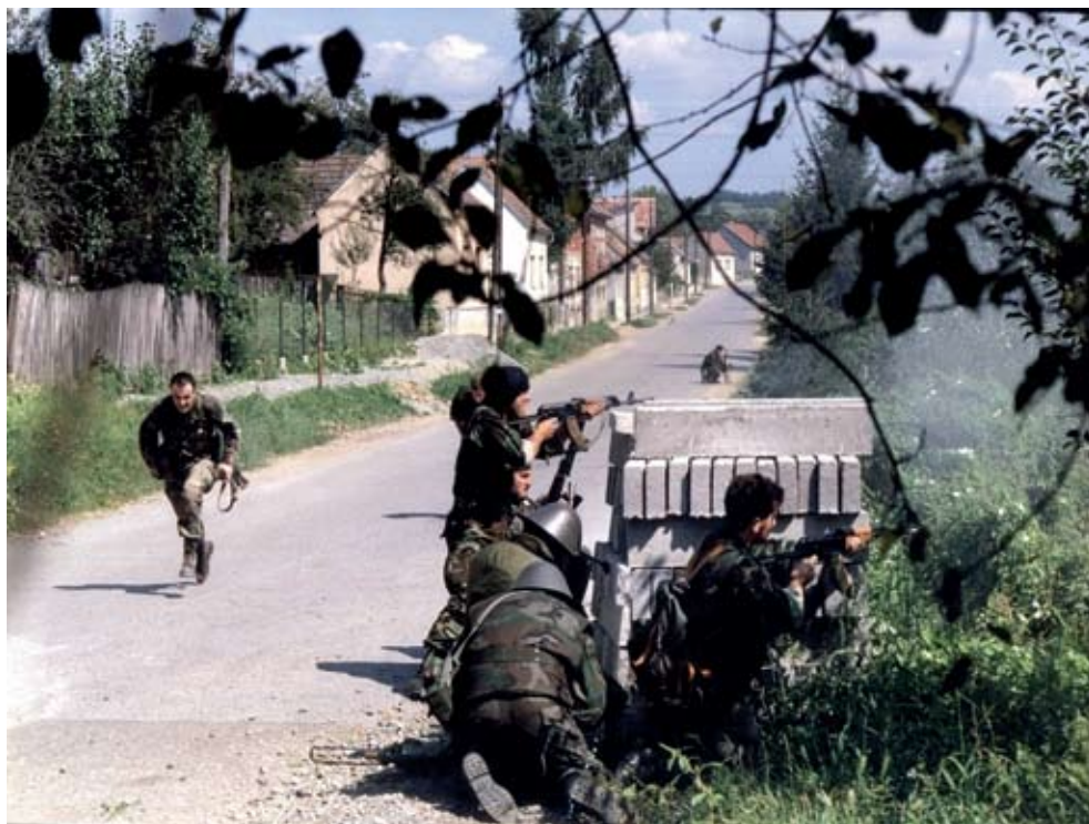
Slika 3. Omega u bitci za Kusunje

u pomoć, uz ljudstvo Risova , i dva borbena oklopna vozila iz Kutine i Garešnice. 124 Oko 12,30 sati Omega su već stupile u borbu s pobunjenicima kod Kusunja. 125