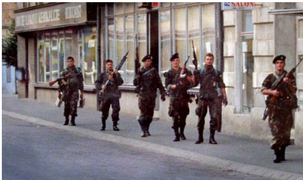
Slika 2. Bjelovarski specijalci u prvoj intervenciji u Pakracu 2. ožujka 1991.

„čišćenje“ širega područja grada, te su ga uskoro stavile pod kontrolu. U poslijepodnevnom satima ponovno su s Kalvarije napadnuti punktovi specijalaca. Ubrzo su u Pakrac ušle oklopno-motorizirane snage Jugoslavenske narodne armije, rasporedivši se u centru grada, ispred Vladikina dvora i zgrade Općine, gdje se okupio veći broj građana srpske nacionalnosti protestirajući protiv specijalaca. I hrvatska strana dobiva pojačanje dolaskom drugih specijalnih postrojbi: Rakitje, Pionirac, Kumrovec. Nakon cjelodnevnih pregovora predstavnika Hrvatske, Socijalističke Federativne Republike Jugoslavije, Jugoslavenske narodne armije i lokalnih Srba ponovo je oko 18 sati počela pucnjava po zgradi policije i općine. 21 Idućih dana uslijedilo je vraćanje oružja koje su pobunjenici odnijeli iz policijske stanice, nakon čega kontrolu nad gradom preuzima redovna policija. 22