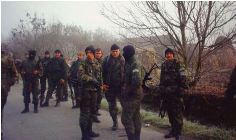
Slika 7. Omega u oslobodilačkoj operaciji Otkos-10

bodilačka operacija. Rezultati njezine prve faze provedbe bili su skromni. Oslobođeno je selo Bair, koje je uskoro izgubljeno.