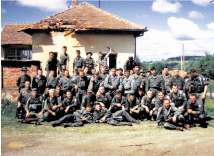
Slika 7. Rogolji – aktivnosti nakon završetka Vojno-redarstvene operacije Bljesak

ma dana 3. i 4. svibnja 1995. godine sudjelovala u potiskivanju terorističkih skupina na području Ivanovca preko Hajdučke Kose, Plandišta do Omanovca.