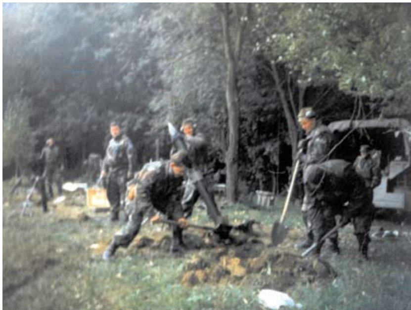
Slika 5. Mala Pisanica – priprema minobacačke bitnice za bojno djelovanje