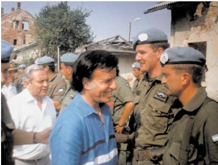
Slika 3. Predsjednik Argentine Carlos Menem u obilasku UN-ova argentinskog bataljuna u Pakracu

Aktivnost srbočetničkih skupina na području Općine Grubišno Polje započeta je 11. kolovoza 1991. s otmicom civila u selima Bilogore i putnika na magistralnoj cesti Virovitica – Grubišno Polje. Nakon toga srbočetničke formacije, posebno s područja