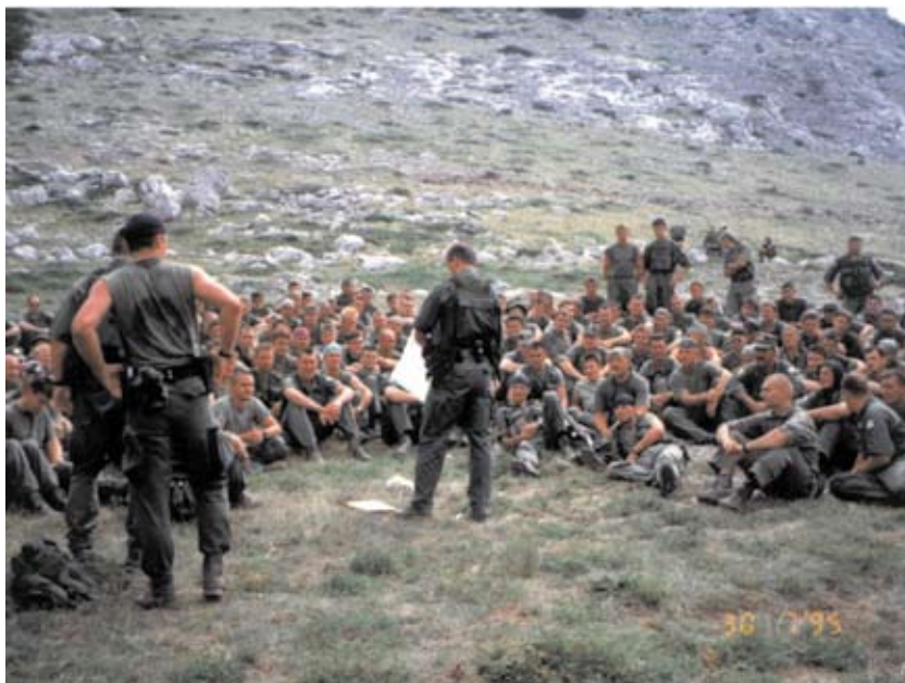
Slika 8. Bukva – pripreme za provođenje vojno-redarstvene akcije Oluja

Od početka Domovinskog rata vrlo važnu ulogu u borbenim aktivnostima imao je sanitet, kasnije nazvan Kirurško-mobilne anesteziološke ekipe – KAME, koje su od provođenja borbenih aktivnosti na području Pakraca 1991. godine do završne vojno-redarstvene operacije Oluja bile u sastavu specijalne jedinice policije.