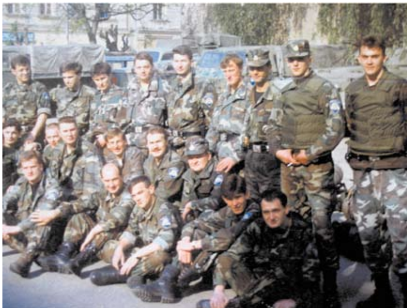
Slika 6. Baza Specijalne jedinice pred polazak u Slavonski Brod

ranim borbenim aktivnostima sa skupnim snagama specijalne policije, jedinica je borbeno djelovala na području mjesta Drljići.