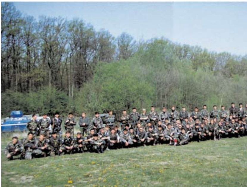
Slika 4. Posebna jedinica Policije – obuka u nastavnom centru Kukavica