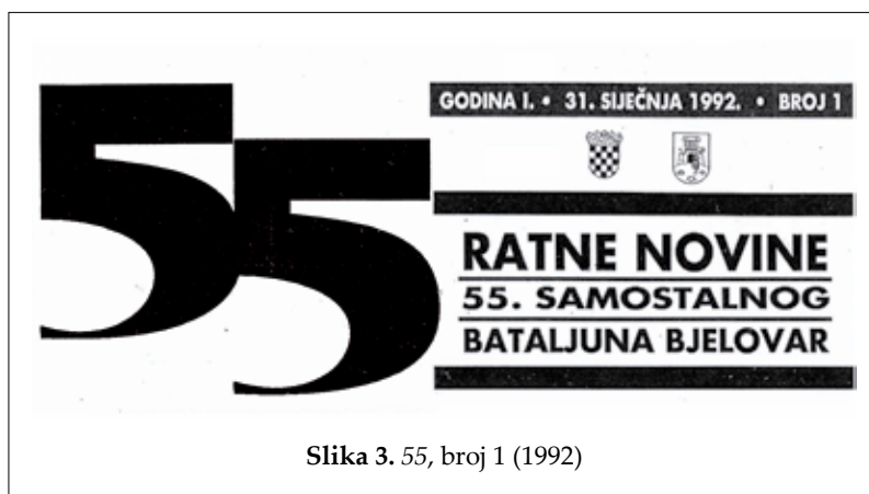
Slika 3. 55, broj 1 (1992)

Zahvaljujući profesionalnom sastavu Uredništva, 55-ica je od samog početka imala sve atribute novina. Njezin novinski lik nije se postupno izgrađivao kroz