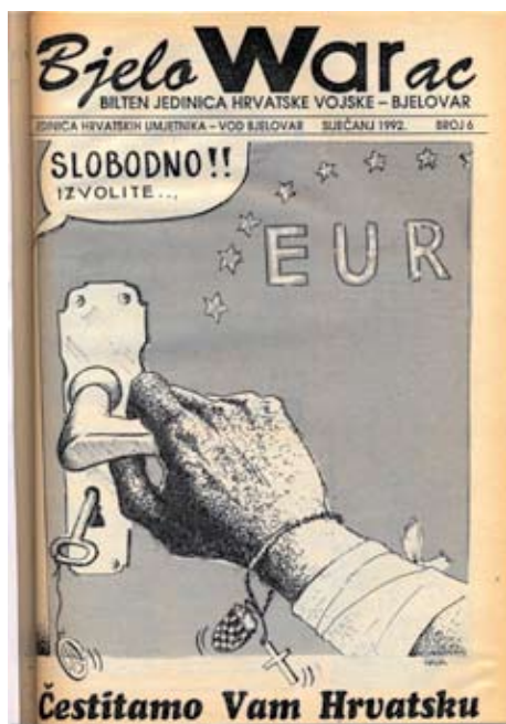
Slika 1. BjeloWARac , broj 6 (1992)

Sedmi, posljednji „ratni“ broj BjeloWARca nosi datum „veljača – ožujak“ 1992. Broj je otisnula bjelovarska Prosvjeta u 1.200 primjeraka. Broj ima osam stranica. Na naslovnici dominira fotografija dječaka s hrvatskom šahovnicom iz Australije, koju su Uredništvu BjeloWARca poslali kolege iz časopisa Klokan , koji su u Sidneyu izdavali mladi Hrvati, od kojih je Mladen Kovačević, u dva navrata, tijekom ratne 1992. bio u Hrvatskoj. Zahvaljujući toj vezi, posljednji brojevi BjeloWARca mogli su se čitati i u Australiji. Središnje mjesto broja posvećeno je posljednjem oproštaju od pripadnika Hrvatske vojske stradalih u Kusunjama. Osim tog središnjeg teksta, brojem dominiraju reportaže iz postrojbi ( Pedečeooci, Ruleti ), reportaža iz Pakraca ( Pakrački bluz s podnaslovom Od Šeovice do Pakraca, vodi jedna tanka nit... možda je maljutka, al' ne mora bit' ). Zanimljiva je i fotovijest o časnicima za vezu Ujedinjenih naroda (UN) u Bjelovaru. Od ostalih vijesti izdvaja se tekst o seminaru za IPD-eovce u organizaciji Operativne zone Bjelovar u Daruvaru. Sedmi je broj važan jer je prvi