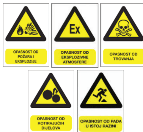
Slika 3 – Primjeri za znakove opasnosti

Znakovi opasnosti postavljaju se na mjesta gdje postoji stalna ili potencijalna opasnost od ozljeda, otrovanja, požara, eksplozije ili sl. kao npr. opasnost od eksplozivne atmosfere, opasnost od požara, opasnost od eksplozije, opasnost od električne struje, opasnost od rotirajućih dijelova itd.