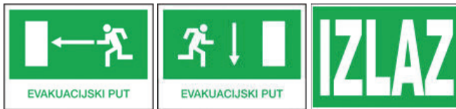
Slika 4 – Primjeri za znakove obavijesti

Po obliku, znakovi obavijesti mogu biti kvadratnog ili pravokutnog oblika, a boja koja dominira u znaku je zelena, jer ona mora prekrivati najmanje 50 % ukupne površine znaka. Kontrastna boja znaka je bijela, što znači da su grafički simboli ili tekst izvedeni bijelom bojom, a pozadina znaka je zelena. Znakovi obavijesti postavljaju se na mjesta koja se, zbog sigurnosti ili obavješavanja, moraju posebno označavati kao npr. prva pomoć, smjer za evakuaciju, izlaz itd. Kako bi se udovoljilo zakonskim propisima koji zahtijevaju organiziranu evakuaciju i spašavanje u slučajevima raznih nepredviđenih događaja, u poduzećima se izrađuju odgovarajući planovi evakuacije i spašavanja te poduzimaju određene aktivnosti. Na vidljivim mjestima, u svim objektima i pogonima poduzeća, moraju biti postavljeni shematski prikazi objekata i pogona s ucrtanim putovima za evakuaciju i mjestima okupljanja nakon izvršene evakuacije. Svi evakuacijski putovi, od najudaljenijeg radnog mjesta pa sve do izlaza na otvoreni prostor, moraju biti označeni odgovarajućim standardiziranim znakovima sigurnosti. Znakovi moraju biti vidljivi danju i noću, pa se zbog toga često izrađuju od reflektirajućeg materijala.