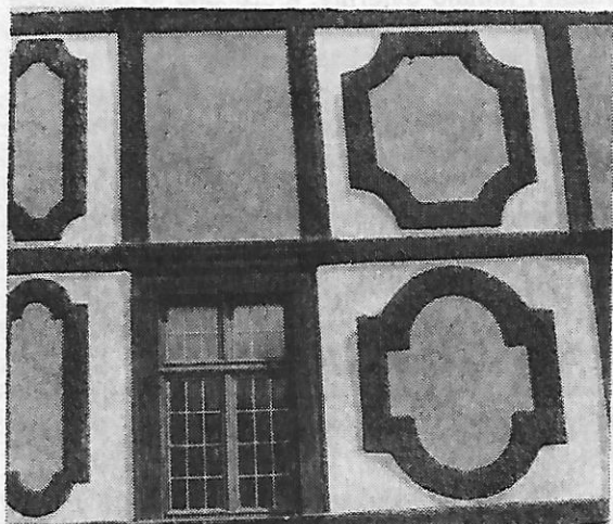
Sl. 1 — Medaljoni na palači Sermage nakon obnove

Najveće rezerve mogu se iznjeti prema načinu na koji je prilikom obnove zapadne i sjeverne fasade prvog tvrđavskog dvorišta restauriran vodoravni niz rozeta koji se proteže ispod