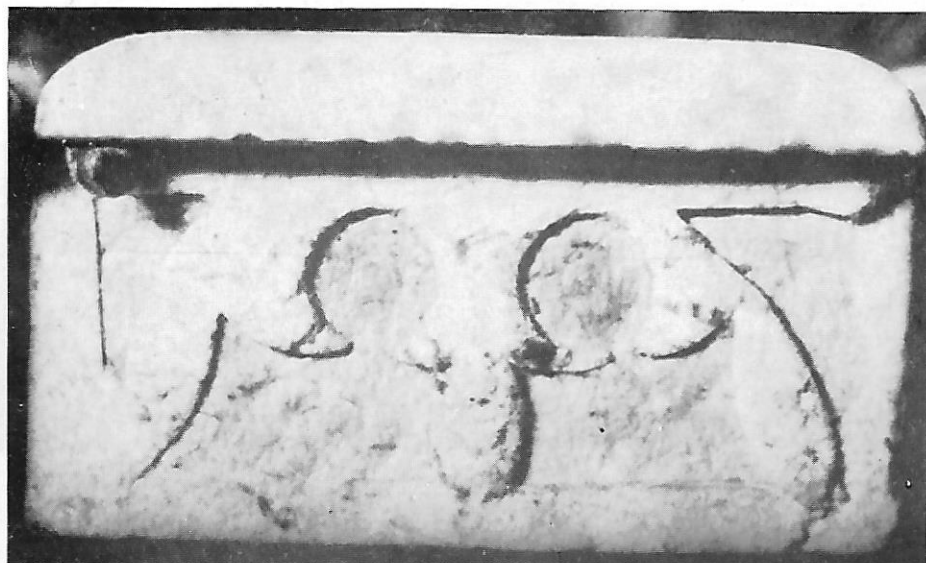
30. Pozitiv iz Borla, čelo tipaka