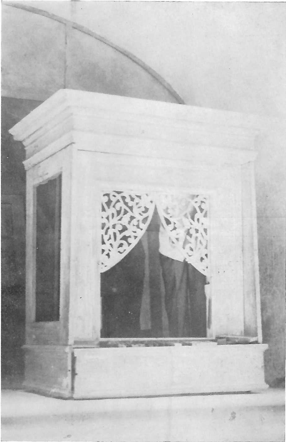
31. Pozitiv iz Vukovoja, gornji dio