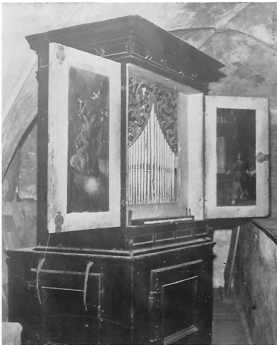
28. Pozitiv iz borla, prospekt