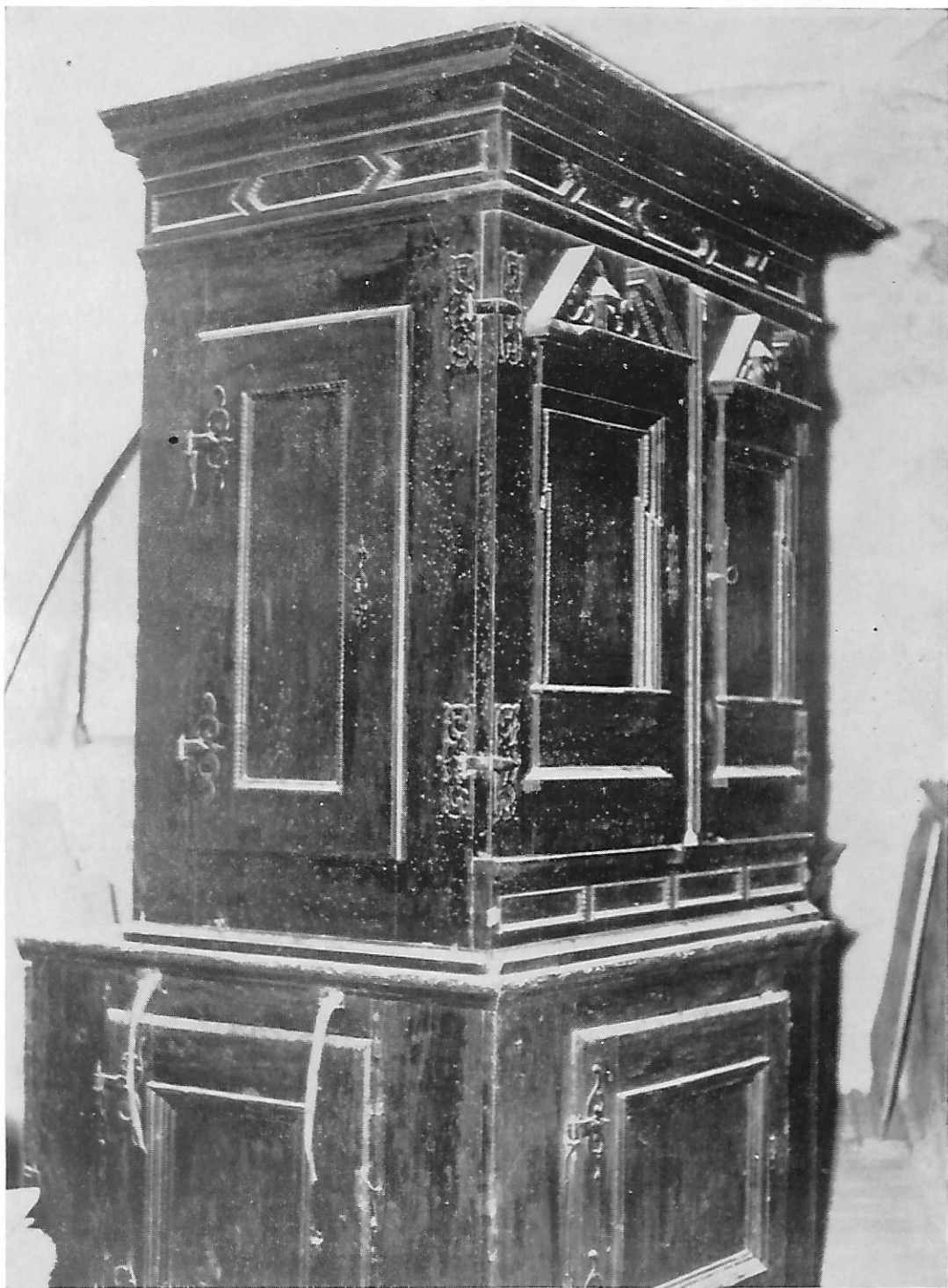
27. Pozitiv iz Borla, pročelje