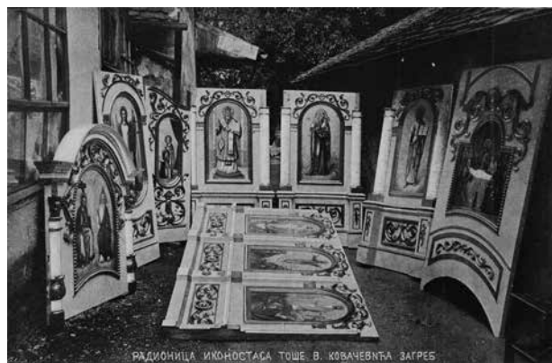
9. Promotivna razglednica s ikonama zagrebačkog slikara Toše V. Kovačevića namijenjenim za prodaju / Promotional postcard with icons by the Zagreb painter Tošo V. Kovačević destined for sale

Povratak ikona sa staroga orahovičkog ikonostasa u manastir bio je moguć stoga što je, vjerojatno 1905., postavljen novi ikonostas u poganovačkoj crkvi. 34 Ovaj ikonostas stoji i danas i gotovo je potpuno sačuvan. Tijekom Drugoga svjetskog rata, nakon što je krajem 1941. poganovačka crkva pretvorena u katoličku, bio je razmontiran, iznesen iz crkve i stajao je na tavanu škole i zgrade tzv. straže u središtu sela. 35 Pri paljenju škole krajem rata ikonostas je već vraćen u crkvu. Na tavanu su ostala samo dvoja bočna vrata koja su tom prilikom izgorjela. Nova vrata nisu nikada načinjena, te danas na njihovu mjestu stoje vezeni ručnici, pokloni mještana.