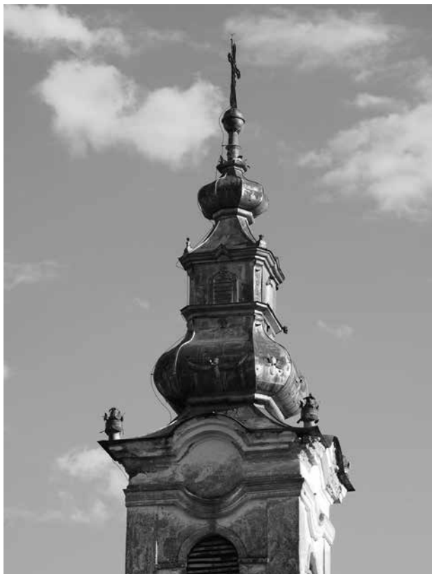
6. Kupola tornja poganovačke crkve / Belfry dome of the church in Poganovci