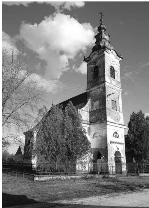
4. Zapadno pročelje crkve u Poganovcima, današnje stanje / Western façade of the church in Poganovci, present state