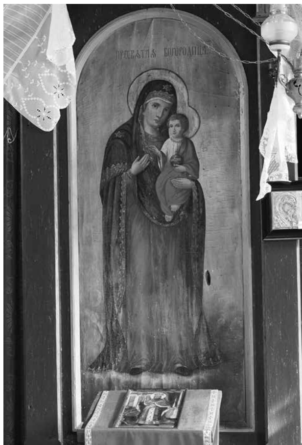
8. Bogorodica s Kristom, ikona na ikonostasu crkve u Poganovcima / Madonna and Child, icon on the iconostasis of the church in Poganovci

u Poganovcima, nije teško ustanoviti. Manastiru je, naime, kao hodočasničkom centru, selo gravitiralo. Orahovica je bila duhovni centar ne samo za sela požeške okoline nego jednako tako i za područje ravničarskog dijela Slavonije, odnosno istočnoga slavonskog Podravlja. 33 Poganovcima su, kao siromašnom selu koje do tada u crkvi nije imalo pravog ikonostasa, orahovački monasi poklonili stare ikone nerazumijevajući u to vrijeme još uvijek njihovu vrijednost.