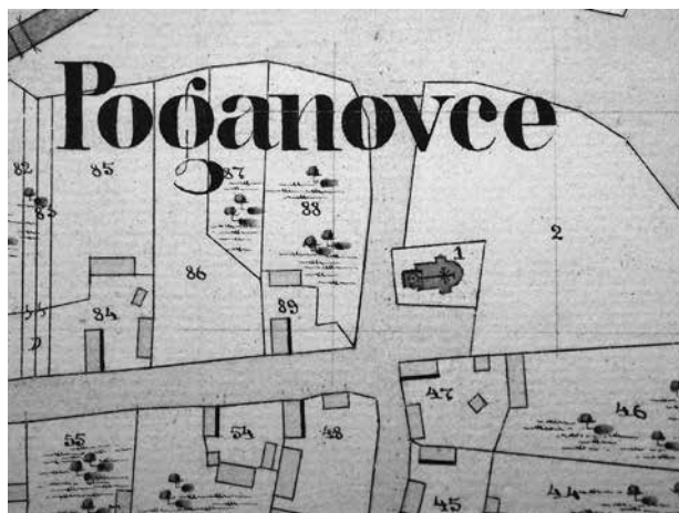
2. Obrisi tlocrta crkve u Poganovcima prema katastarskom planu iz 1862.; Hrvatski državni arhiv (HDA), fond br. 1421, Arhiv mapa za Hrvatsku i Slavoniju, Poganovci, VIR. 162 / Ground plan outline of the church in Poganovci according to the cadastral survey of 1862; Croatian State Archives, fond n. 1421, Archives of maps of Croatia and Slavonia, Poganovci, VIR. 162

Na ovu prvu drvenu roganovačku crkvu odnose se vjerojatno i podaci u katoličkim kanoničkim vizitacijama Pečuške biskupije iz prvih desetljeća 19. stoljeća. Poganovci su naime pripadali administrativno pod vrlo prostranu župu u Brođancima (koja je obuhvaćala osim samih Brođanaca i sela Habjanovce, Martince, Budimce, Poganovce te dulje vremena Čepin), a koja je bila u sastavu Valpovačkog dekanata ove mađarske biskupije. U selu je živjelo u to vrijeme vrlo malo katolika – na primjer, 1810. bio je sedam katolika i 279 pravoslavaca, tako da se nije pristupilo gradnji sakralne građevine za ovu konfesionalnu skupinu; 9 vizitatori, međutim, redovito bilježe sve sakralne građevine koje su postojale u mjestima brođanačke župe, pa tako i pravoslavne. Prva vizitacija u kojoj se spominje roganovačka crkva datirana je u 1810. godinu, 10 a potom se ponovno spominje u vizitaciji obavljenoj između 24. i 25. srpnja 1829. 11 Nažalost, vizitatori ne preciziraju od kojega je materijala crkva sagrađena niti u bilo kojemu smislu opisuju građevinu.