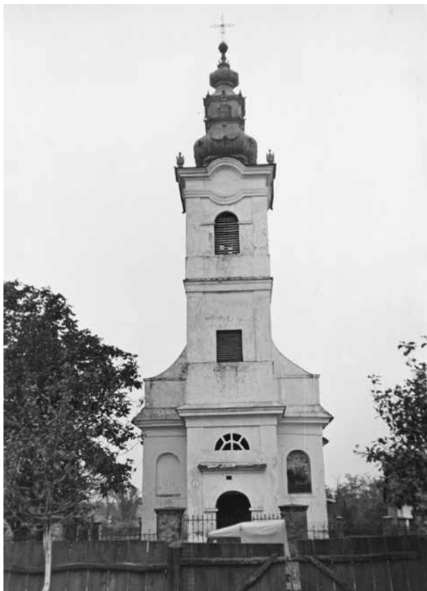
3. Glavno, zapadno pročelje crkve u Poganovcima 1958. godine (foto: N. Vranić, Ministarstvo kulture, fototeka, inv. br. 19618, br. negativa I-A-154) / Main, western façade of the church in Poganovci in 1958 (photo N. Vranić, Ministry of Culture, Photo Library, inv. n. 19618, neg. I-A-154)