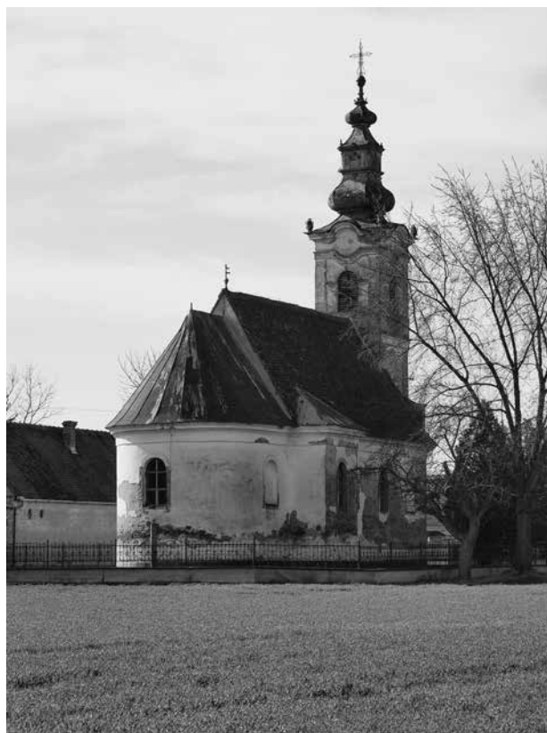
5. Sjeverno pročelje i apsida crkve u Poganovcima, današnje stanje / Northern façade and apse of the church in Poganovci, present state

Poganovačkoj crkvi po tipu raščlambe i položaju zvonika najbliže su crkve podignute na području valpovačkog vlaste-