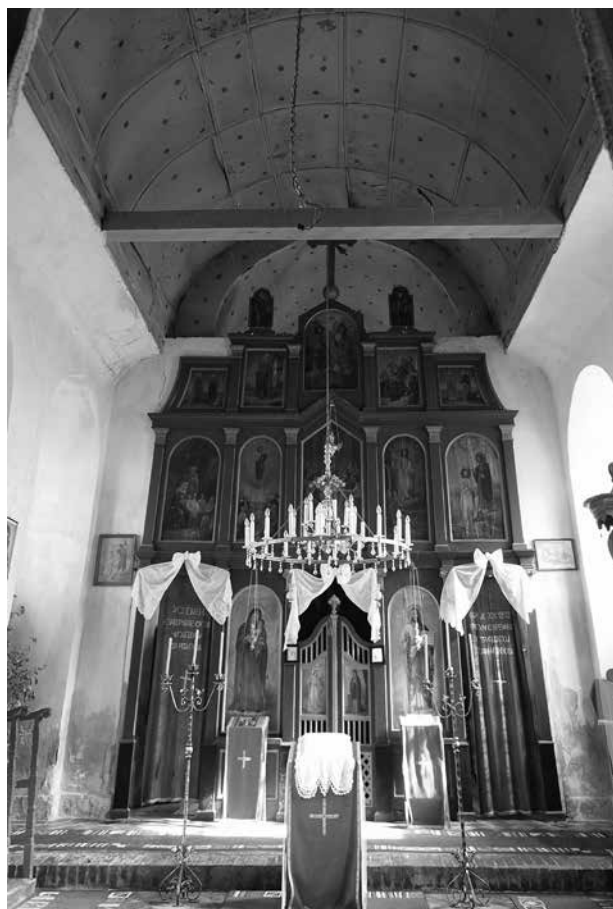
7. Unutrašnjost crkve u Poganovcima, pogled prema ikonostasu / Interior of the church in Poganovci, view towards the iconostasis

Glavni dio opreme crkve, ikonostas, kasniji je rad, vjerojatno iz 1905. godine. Prvotni ikonostas nesumnjivo je bio vrlo skroman, možda i prenesen iz stare drvene crkve. Tek