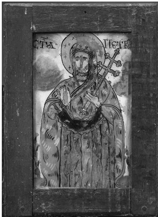
11. Sv. Petka, ikona na staklu u crkvi u Poganovcima, vjerojatno iz 19. stoljeća / St Paraskeva, icon on glass in the church in Poganovci, probably 19 th century