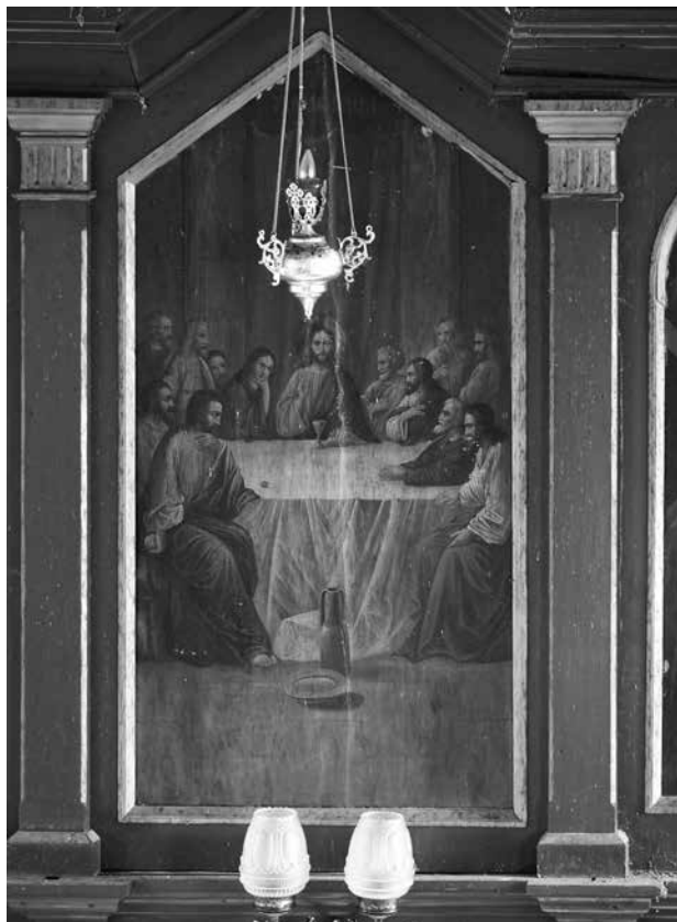
10. Tajna (Posljednja) večera, ikona na ikonostasu crkve u Poganovcima / Secret (Last) Supper, icon on the iconostasis of the church in Poganovci