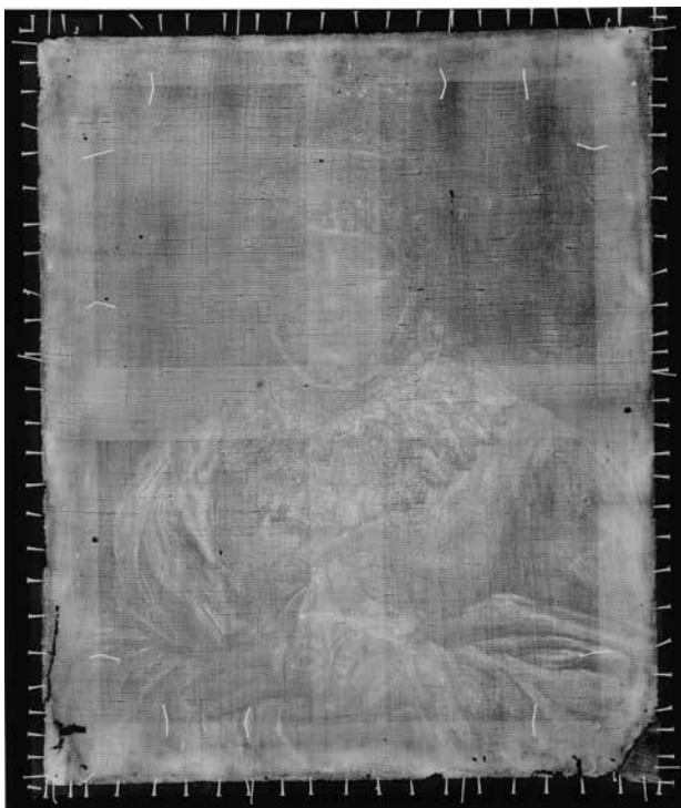
8. Antoine-Jean Gros, Portret Madame Récamier, Strossmayerova galerija starih majstora HAZU, rendgenska snimka / Antoine-Jean Gros, Portrait of Madame Récamier, Strossmayer Gallery of Old Masters, X-ray image