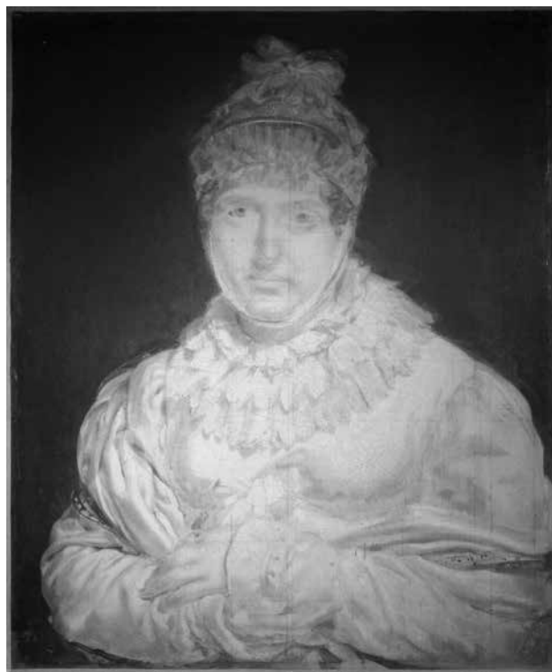
10. Antoine-Jean Gros, Portret Madame Récamier, Strossmayerova galerija starih majstora HAZU, infracrvena snimka / Antoine-Jean Gros, Portrait of Madame Récamier, Strossmayer Gallery of Old Masters, infrared image