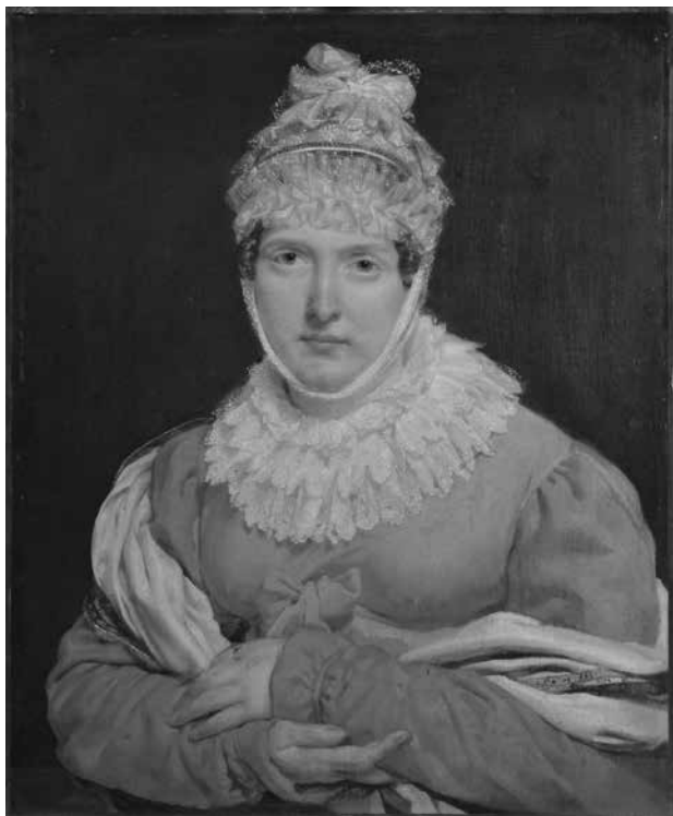
3. Antoine-Jean Gros, Portret Madame Récamier, ulje na platnu, 62,3 × 51,2 cm, Strossmayerova galerija starih majstora HAZU, inv. br. 36 / Antoine-Jean Gros, Portrait of Madame Récamier, oil on canvas, 62.3 × 51.2 cm, Strossmayer Gallery of Old Masters, inv. n. 36