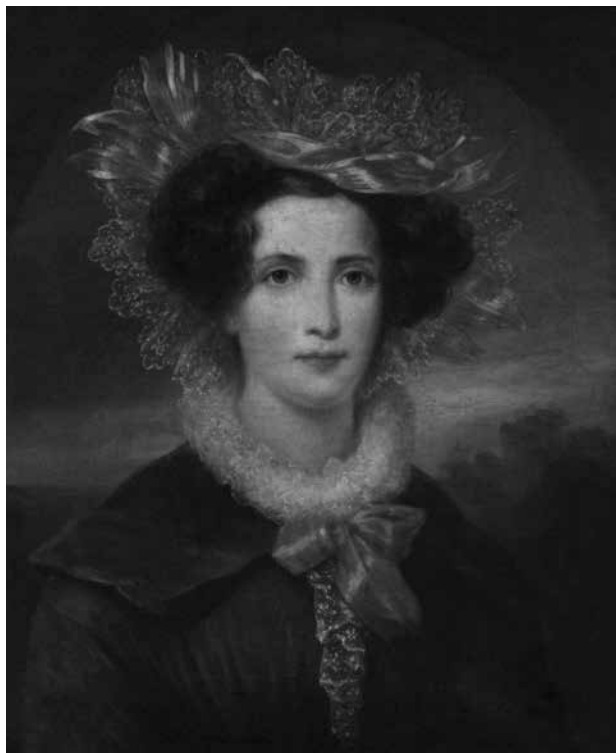
4. Neimenovani slikar prve polovine 19. stoljeća, Portret djevojke , ulje na platnu, 64,7 × 54,1 cm, Strossmayerova galerija starih majstora HAZU, inv. br. 38 / Unknown painter of the first half of the 19 th century, Portrait of a Girl , oil on canvas, 64.7 × 54.1 cm, Strossmayer Gallery of Old Masters, inv. n. 38