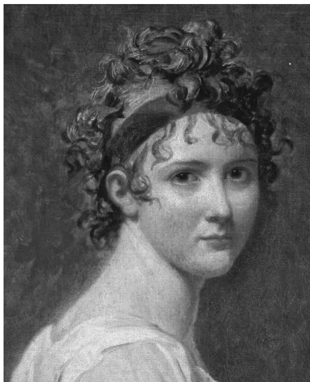
2. Jacques-Louis David, Portret Madame Récamier , detalj / Jacques-Louis David, Portrait of Madame Récamier , detail

Stariji izvori navode kako bračni par nije imao zakonitog nasljednika, stoga se, prema bračnom ugovoru, suprugov imetak imao vratiti njegovoj obitelji. 12 Recentnim istraživanjima, tj. uvidom u bračni ugovor iz 1886. godine supružnika de Piennes–MacMahon, 13 potvrđena je prethodno navedena klauzula te je utvrđeno kako umjetnine nisu bile dijelom miraza grofa de Piennesa. 14 Članak 3. bračnog ugovora o »Zadržavanju vlastite imovine« ističe na kraju: »Izuzeta su