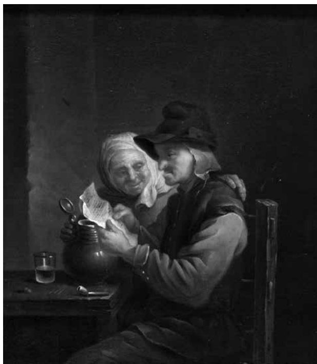
5. Prema Davidu Teniersu ml., Muškarac čita i žena za stolom , nakon 1640., ulje na dasci, 25 × 22,2 cm, Strossmayerova galerija starih majstora HAZU, inv. br. SG-157 / After David Teniers the Younger, Man Reading and Woman at Table, after 1640, oil on panel, 25 × 22.2 cm, Strossmayer Gallery of Old Masters, inv. n. SG-157

1972. godine zabilježeno na tržištu umjetninama. 82 Poznat je iznimno velik broj reproduktivnih grafika i slika prema djelima Davida Teniersa ml., koji je već u 17. stoljeću, kao i Adriaen van Ostade, »zu einem vielfach kopierten ›Markennamen‹ avanciert war.« 83 Alfred von Wurzbach navodi mogući razlog: »Die Stiche nach den Bildern D. Teniers sind unzählige, denn er ist unstreitig jener Maler, dessen Gemälde am geeignetesten waren, als Zimmerschmuck verwendet zu werden.« 84 Iako Teniers vrhunac recepcije i popularnosti doseže u 18. stoljeću, već za vrijeme njegova života nastaju kopije i grafike prema njegovim djelima, za koje se smatra da su morale nastati pod nekim vidom slikareva nadzora. 85