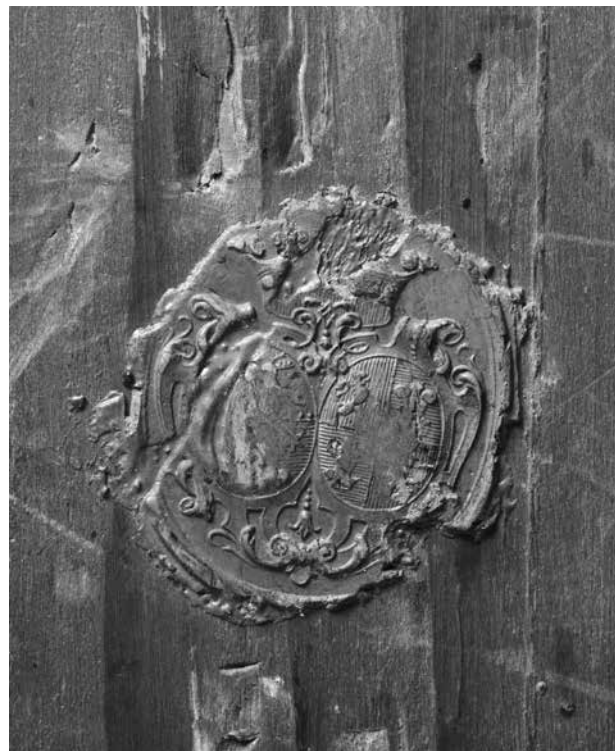
2. Grb na poleđini sl. 1 / Coat of arms on the back of fig. 1

Strossmayerove galerije sve do 1922. godine. 45 Gabriel Térey 1926. mijenja atributivno određenje u Cornelis Janssens van Ceulen, 46 što se zadržava u svim kasnijim katalogima Galerije. 47 Sastavljači galerijskih kataloga nisu prihvatili Losskyjev atributivni prijedlog Philippeu de Champaigneu iznesen 1938. godine, 48 na osnovi kojeg je međutim slika uvrštena u slikarevu monografiju 1976. godine. 49 I Đuro Vandura se 1988. u katalogu nizozemskih slikarskih škola u Strossmayerovoj galeriji priklonio atribuciji Van Ceulenu. 50 Slika danas nije u stalnome postavu Galerije.