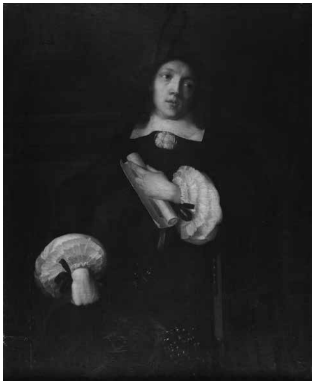
1. Flamanski slikar 17. stoljeća, Portret mladog pjesnika , 1650.–1670., ulje na platnu, 113,4 × 93,6 cm, Strossmayerova galerija starih majstora HAZU, inv. br. SG-136 / Unknown Flemish 17 th -century painter, Portrait of a Young Poet , 1650–1670, oil on canvas, 113.4 × 93.6 cm, Strossmayer Gallery of Old Masters, inv. n. SG-136