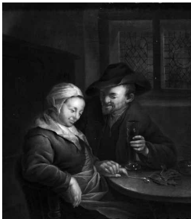
4. Prema Adriaenu van Ostadeu, Seljak se udvara starijoj ženi , nakon 1653., ulje na dasci, 25,2 × 22,2 cm, Strossmayerova galerija starih majstora HAZU, inv. br. SG-158 / After Adriaen van Ostade, Peasant Courting an Older Lady , after 1653, oil on panel, 25.2 × 22.2 cm, Strossmayer Gallery of Old Masters, inv. n. SG-158

U Strossmayerovoj su se galeriji »dvije krasne sličice od Teniersa« uvriježeno identificirale kao slike Ples pred krčmom i Tučnjava . 73 Međutim, iz uvida u rukopisni popis Haulikova inventara jasno proizlazi da Haulikovi »Teniersi« navedeni kao »2 kleine holländisch Bauern – Conversatz. Stücke, in beyden ein Bauer und Bäuerin Tennier « nisu višefiguralne kompozicije nego slike s prikazom po jednog seljaka i seljanke. U zbirci ih je uistinu moguće prepoznati, ali u drugim dvjema slikama: Seljak se udvara starijoj ženi i Muškarac čita i žena za stolom . Prvi su put te slike u Strossmayerovoj zbirci zabilježene 1883. godine kao djela »holandezke škole«. 74 Oznaka nizozemske škole ponavlja se u dva sljedeća kataloga Galerije, 75 sve do 1895. godine kada su slike naznačene kao kopije po Davidu Teniersu ml. 76 Vandura ih je interpretirao kao dio ciklusa Pet osjetila određivši ih kao Sluh odnosno Vid te ih je pripisao Ferdinandu Apshovenu ml., na osnovi vlastite interpretacije monograma »AB« na jednoj slici kompozicijski