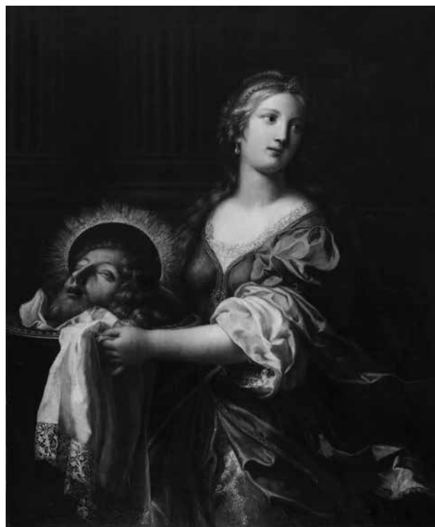
3. Onorio Marinari, Saloma s glavom Ivana Krstitelja , 1680.–1685., ulje na platnu, 115,5 × 96,4 cm, Strossmayerova galerija starih majstora HAZU, inv. br. SG-172 / Onorio Marinari, Salome with the Head of St John the Baptist , 1680–1685, oil on canvas, 115.5 × 96.4 cm, Strossmayer Gallery of Old Masters, inv. n. SG-172

Razrješenje atributivne dvojbe i kontekstualiziranje slike u opusu firentinskoga baroknog slikara Onorija Marinarija isprva se temeljilo na primjercima fotografije slike sačuva-