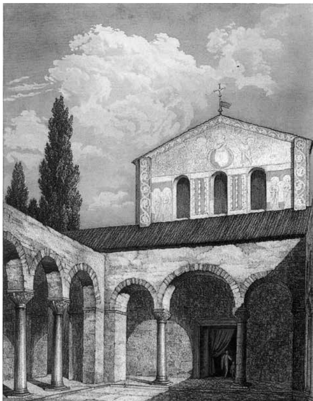
1. Gustav Heider, Rudolf Eitelberger, Mittelalterliche Kunstdenkmale des österreichischen Kaiserstaates , Stuttgart, 1858., tabla XIII, Parenzo / Gustav Heider, Rudolf Eitelberger, Mittelalterliche Kunstdenkmale des österreichischen Kaiserstaates , Stuttgart, 1858, Plate XIII, Parenzo

nički spomenici Dalmacije u Rabu, Zadru, Trogiru, Splitu i Dubrovniku. 18