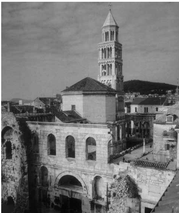
3. Današnji pogled na splitsku katedralu / Split Cathedral today