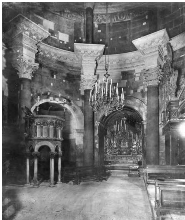
4. Unutrašnjost splitske katedrale, Knjižnica ALU, Zagreb, Album Josefa Wlha, između 1894. i 1902., inv. br. 2919 / Interior of Split Cathedral, Library of the Academy of Fine Arts, Zagreb, Album of Josef Wlha, between 1894 and 1902, inv. n. 2919

prikupljanja materijala za topografiju i kohezije konzervatora i dopisnika održane su i konzervatorske konferencije u Klagenfurtu 1883., Steyru 1884., Beču 1885. i Krakovu 1888. godine. 25 Jedina objavljena umjetnička topografija bila je ona Koruške iz 1889. godine. 26