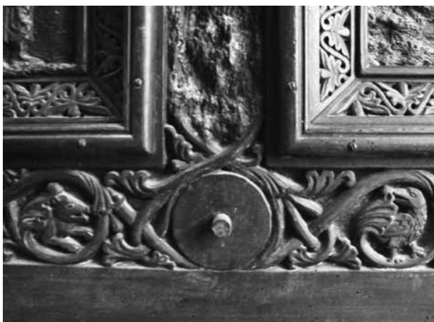
6. Kontakt koncepta čuvanja starosne vrijednosti i stilskog restauriranja na Buvininim vratnicama (snimio: F. Ćorić, 16. VI. 2014.) / Point of intersection of the concept of age value preservation and stylistic restoration on the doors of Andrija Buvina (photo: F. Ćorić, 16 June 2014)

Povjerenstva za Dioklecijanovu palaču. 42 Tek se 1909. godine većina članova toga Povjerenstva izjasnila za očuvanje, a protiv rušenja biskupske palače, tj. za koncept čuvanja slojevitosti i ambijenta, a protiv stvaranja arheološkog areala u splitskoj gradskoj jezgri.