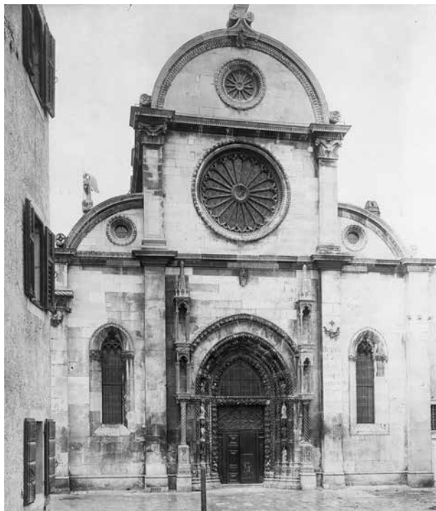
2. Pročelje šibenske katedrale, Knjižnica ALU, Zagreb, Album Josefa Wlha, između 1894. i 1902., inv. br. 2039 / Façade of Šibenik Cathedral , Library of the Academy of Fine Arts, Zagreb, Album of Josef Wlha , between 1894 and 1902, inv. n. 2039

Najdalekosežniji projekt bio je onaj dalmatinskoga namjesničkog inženjera Sigmunda Ransberga koji je do 1854. godine izradio projekt statičkog saniranja i restauriranja šibenske katedrale u kojem je predviđao demontažu i zamjenu ploča svodne konstrukcije glavnog broda i arhitektonske plastike velikih partija katedrale (sl. 2). 21