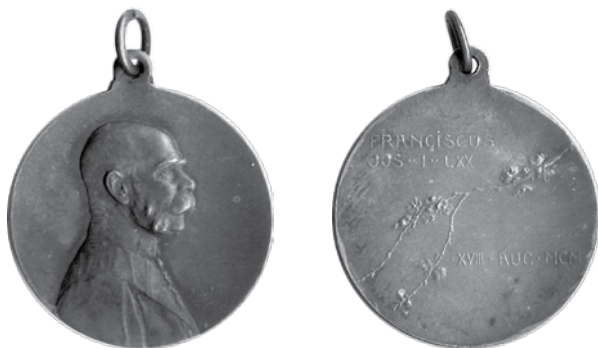
9. Rudolf Marschall, Franjo Josip I., 70. rođendan, 1900.; srebro, veličina: 30 mm, Arheološki muzej u Zagrebu / Rudolf Marschall, Franz Joseph I, 70 th birthday, 1900, silver, dim.: 30 mm, The Zagreb Archaeological Museum