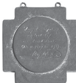
14. Rudolf Marschall, Pio X., zlatni svećenički jubilej 1908.; pozlaćena bronca, veličina: 40 × 51 mm, Arheološki muzej u Zagrebu / Rudolf Marschall, Pius X, golden jubilee of ordination to the priesthood, 1908, bronze gilt, dim.: 40 × 51 mm, The Zagreb Archaeological Museum

Verdienst des also Bevorzugten liegt in seinem Fleisse, seinem Talente erst Wert verleiht, denn nur durch diese war es möglich, dass Marschall in so jungen Jahren schon so Bedeutendes geleistet und so viele Erfolge aufzuweisen hat, welche leicht zur Selbstüberhebung, die gleichbedeutend mit Stillstand und Rückgang im Schaffen eines Künstlers ist, führen könnten. Bei Marschall ist dies nicht zu fürchten, denn er gehört zu jenen Künstlern, die stets an ihren eigenen Arbeiten strengste Kritik üben, die sich nie oder selten mit ihren Leistungen zufrieden geben und an ihrer künstlerischen Vervollkommnung unermüdlich weiter arbeiten. Auf seinen Reisen durch Deutschland, Frankreich und Italien hat er mannigfache Gelegenheit zu interessanten Studien gefunden, der stete Vergleich mit den besten Werken alter und neuer Meister hat ihm einen Maasstab fuer seine eigene Schöpfungen gegeben und ihm den weiten Weg vorgezeichnet, den er auf seiner künstlerischen Laufbahn noch zurückzulegen hat.« 22