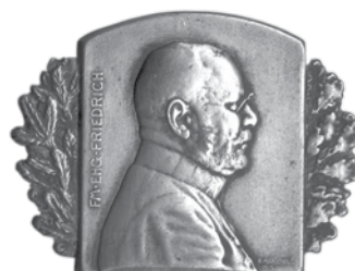
19. Rudolf Marschall, nadvojvoda Friedrich, ratna značka 1915.; željezo, veličina: 43 × 43 mm, Arheološki muzej u Zagrebu / Rudolf Marschall, Archduke Friedrich, war badge, 1915, iron, dim.: 43 × 43 mm, The Zagreb Archaeological Museum