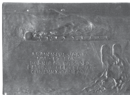
11. Rudolf Marschall, otvorenje bosansko-hercegovačke-dubrovačke željeznice, 1901.; jednostrana plaketa, bronca, veličina: 61 × 44 mm, Arheološki muzej u Zagrebu / Rudolf Marschall, the inauguration of the Bosnian-Herzegovinian-Dubrovnik railway, 1901, uniface plaquette, bronze, dim.: 61 × 44 mm, The Zagreb Archaeological Museum