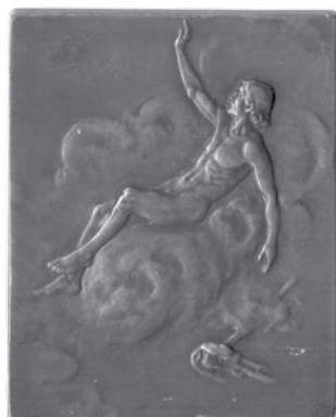
13. Rudolf Marschall, Josip Juraj Strossmayer, smrt 1905.; bronca, veličina: 40 × 51 mm, Arheološki muzej u Zagrebu / Rudolf Marschall, Josip Juraj Strossmayer, death, 1905, bronze, dim.: 41 × 51 mm, The Zagreb Archaeological Museum

Damenspenden (Cotillons, kotiljoni), od kojih su reproducirane dvije, nažalost u crno-bijeloj tehnici. 16 Marschall ih je izrađivao u tehnici polirane i nepolirane površine, a bile su ovješene na šarene vrpce. 17