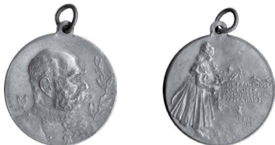
7. Rudolf Marschall, Franjo Josip I., 50. obljetnica vladanja 1898.; medaljica s dječjom povorkom, bronca, veličina: 30 mm, Arheološki muzej u Zagrebu / Rudolf Marschall, Franz Joseph I, 50 th anniversary of reign, 1898, medal with children's parade, bronze, dim.: 30 mm, The Zagreb Archaeological Museum

ljevala, što sam ja i učinio, stekao iskustvo koje je meni bilo potrebno za vođenje ljevaone uz moje već prije stečeno znanje u cizeliranju... 11