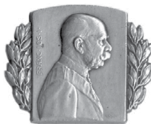
18. Rudolf Marschall, Franjo Josip I., ratna značka 1915.; kositar, veličina: 40 × 33 mm, Arheološki muzej u Zagrebu / Rudolf Marschall, Franz Joseph I, war badge, 1915, pewter, dim.: 40 × 33 mm, The Zagreb Archaeological Museum