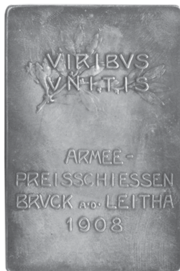
15. Rudolf Marschall, Franjo Josip I., 60. obljetnica vladanja 1908., Bruck an der Leitha, vojno natjecanje u pucanju; srebro, veličina: 46 × 70 mm, Arheološki muzej u Zagrebu / Rudolf Marschall, Franz Joseph I, 60 th anniversary of reign, 1908, Bruck an der Leitha, military shooting contest, silver, dim.: 46 × 70 mm, The Zagreb Archaeological Museum

car. Godine 1910. R. Marschall je sa 41 medaljom sudjelovao na izložbi suvremene medalje pri Američkom numizmatičkom društvu u New Yorku. Među tim medaljama bila je i jedna s likom sir Francisa Drakea, nastala 1907. Usprkos svemu tomu, nije se često pridruživao svojim kolegama na izložbama u Künstlerhausu. Nakon dugog vremena izlagao je ponovno 1943. u okviru proljetne izložbe Društva likovnih umjetnosti u Künstlerhausu. 25 Kad je umjetnik dostigao svoj osamdeseti rođendan, otvorena je izložba 60 njegovih najboljih radova u Numizmatičkom kabinetu Povijesno-umjetničkog muzeja u Beču. 26