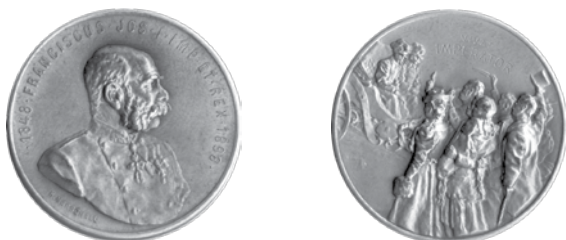
5. Rudolf Marschall, Franjo Josip I., 50. obljetnica vladanja 1898.; medaljica, srebro, veličina: 30 mm, Arheološki muzej u Zagrebu / Rudolf Marschall, Franz Joseph I, 50 th anniversary of reign, 1898; medal, silver, dim.: 30 mm, The Zagreb Archaeological Museum