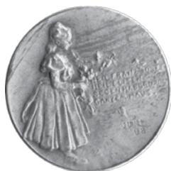
6. Rudolf Marschall, Franjo Josip I., 50. obljetnica vladanja 1898.; medaljica s dječjom povorkom, srebro, veličina: 30 mm, Arheološki muzej u Zagrebu / Rudolf Marschall, Franz Joseph I, 50 th anniversary of reign, 1898, medal with children's parade, silver, dim.: 30 mm, The Zagreb Archaeological Museum