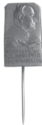
21. Rudolf Marschall, Josip Juraj Strossmayer, Hrvatska sokolska župa Strossmayerova, prije 1929.; značka, bronca, veličina: 17 × 28 mm, Arheološki muzej u Zagrebu / Rudolf Marschall, Josip Juraj Strossmayer, The Croatian Strossmayer Sokol Sports Society, before 1929, badge, bronze, dim.: 17 × 28 mm, The Zagreb Archaeological Museum

Kad se slavio carev šezdeseti jubilej nastupa na prijestolje, i taj je događaj ovjekovječen Marschallovom plakatom. Postoji u dvije veličine (290 × 360 mm, 150 × 220 mm) i u dvije kovine (srebro i lijevana bronca), ali i u kovanim primjercima u srebru i bronci (63 × 92 mm), koje se lako moglo kupiti kod renomiranih bečkih tvrtki, kao npr. Braća Egger. Cijene tih komada kretale su se od 18 do 130 kruna. 46 Za isti jubilej R. Marschall je modelirao i zlatnu nominalu od 100 kruna, smatranu jednim od najljepših kovova toga novijeg doba. 47 Nadalje je R. Marschall primio narudžbu od zajedničke vojske Austro-Ugarske Monarhije za jednu vrstu križa u kombinaciji zlata i platine, s crvenim emajlom i posutog briljantima, koji je uručen caru Franji Josipu I. dana 2. prosinca 1908. 48 Budući da je car odbio sve veće proslave