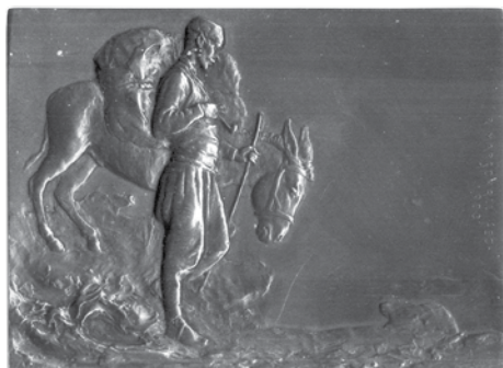
10. Rudolf Marschall, otvorenje bosansko-hercegovačke-dubrovačke željeznice, 1901.; dvostrana plaketa, bronca, veličina: 61 × 44 mm, Arheološki muzej u Zagrebu / Rudolf Marschall, the inauguration of the Bosnian-Herzegovinian-Dubrovnik Railway, 1901, two-sided plaquette, bronze, dim.: 61 × 44 mm, The Zagreb Archaeological Museum