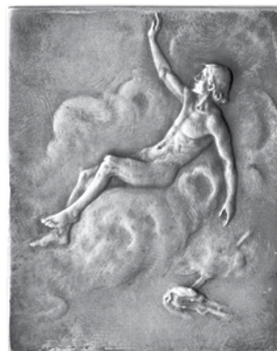
12. Rudolf Marschall, Josip Juraj Strossmayer, smrt 1905.; srebro, veličina: 41 × 51 mm, Arheološki muzej u Zagrebu / Rudolf Marschall, Josip Juraj Strossmayer, death, 1905, silver, dim.: 41 × 51mm, The Zagreb Archaeological Museum

valaca i stičući nove nagrade. Jedna od tih bila je Fügerova zlatna medalja, a druga Gundelova nagrada za specijalne škole za portrete i opće studije. 14 Godine 1902. na izložbi Društva umjetnosti odlikovan je državnim zlatnom medaljom za izložene svoje medalje. 15