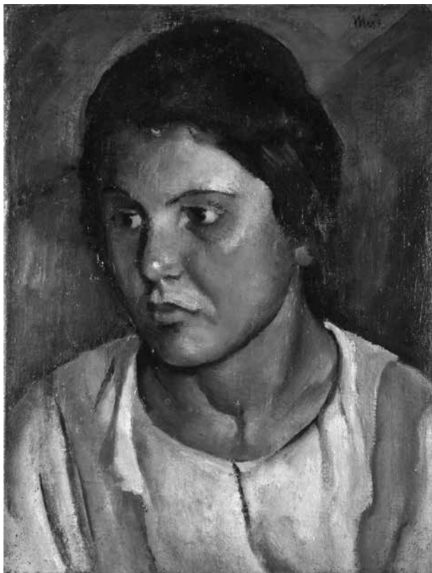
4. Jerolim Miše, Curica , Narodni muzej u Beogradu / Jerolim Miše, Girl , National Museum in Belgrade