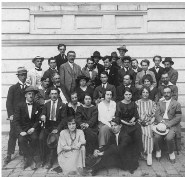
1. Sudionici V. jugoslovenske umetničke izložbe u Beogradu, 1922. / Participants of the 5 th Yugoslav Art Exhibition in Belgrade, 1922