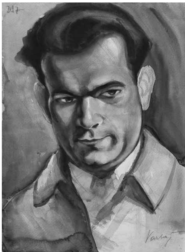
5. Vladimir Varlaj, Skica za portret kipara Frana Kršinića / Vladimir Varlaj, Sketch for the portrait of the sculptor Frano Kršinić

Iza njih stoje Vladimir Varlaj i Jerolim Miše. U pozadini je skulptura Molitva Frana Kršinića, jedna od mnogih (umjetnikovih) verzija ove teme. Imajući u vidu kolekcionarsku strast Jovana Vujića, bilo je logično pretpostaviti kako je on otkupio bar neki od radova s izložbe u Senti, što se pokazalo točnim (sl. 3). U Narodnom muzeju u Beogradu nalaze se slike Curica Jerolima Miše (sl. 4), 41 kao i Skica za portret kipara Frana Kršinića (sl. 5) 42 Vladimira Varlaja, obje evidentirane u katalogu izložbe. O daljem tijeku turneje Grupe nezavisnih umjetnika 1925. godine nema pisanih tragova, fotografija ni identificiranih radova.