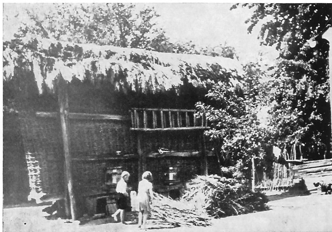
53. „Koš“ ili „kuružar“ u seoskom dvorištu u Donjem Vidovcu — Međimurje