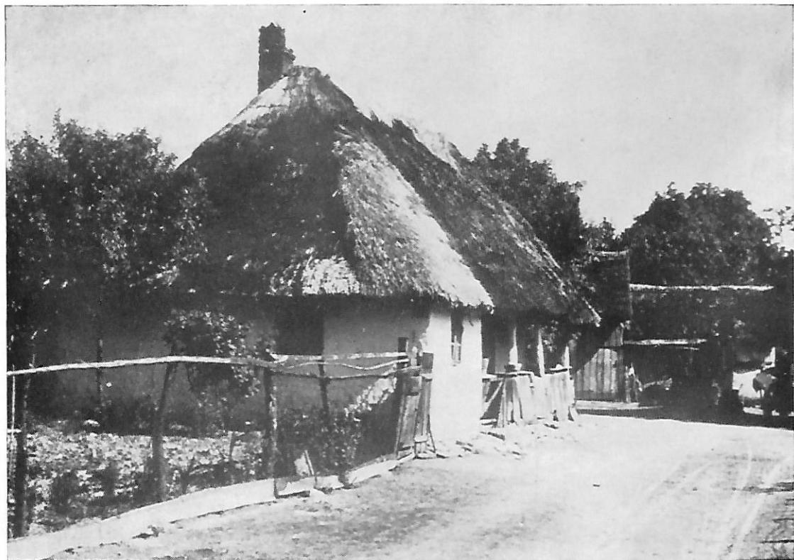
52. Starinske seoske kuće u Sv. Mariji — Međimurje