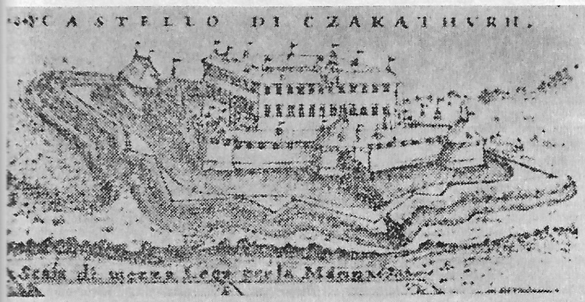
Sl. 2 — Prikaz mjerenja posjeda u Čakovcu iz 17. st. (prema L. Bendeffyju), Mađarski centralni arhiv u Budimpešti

ski pripremajući se za urotu željeli pojačati obrambenu moć svojih gradova, no u tome su spriječeni ranim otkrivanjem urote i gubljenjem vlastitih života. Nakon pogibije Zrinskih prema utvrđenim povjesnim činjenicama, dio bedema i kula starog grada u Čakovcu je srušen, a slabljenjem turske moći prestala je i potreba za podizanjem novih bedema. Jedan dio kamenih blokova sa zidina starog grada upotrebljen je ponovno za izgradnju pojačanja ugaonih pilota palače starog grada nakon razornog potresa koji je zadesio Međimurje u 18. st. Traganja za ostacima bedema i polukružne kule na potezu između južne i istočne kule ostala su bez rezultata. U budućnosti trebat će se istražiti unutrašnjost bedema zapadne kule, te izvršiti konzervacija dosad istraženih kula i ostataka bedema zidina starog grada.