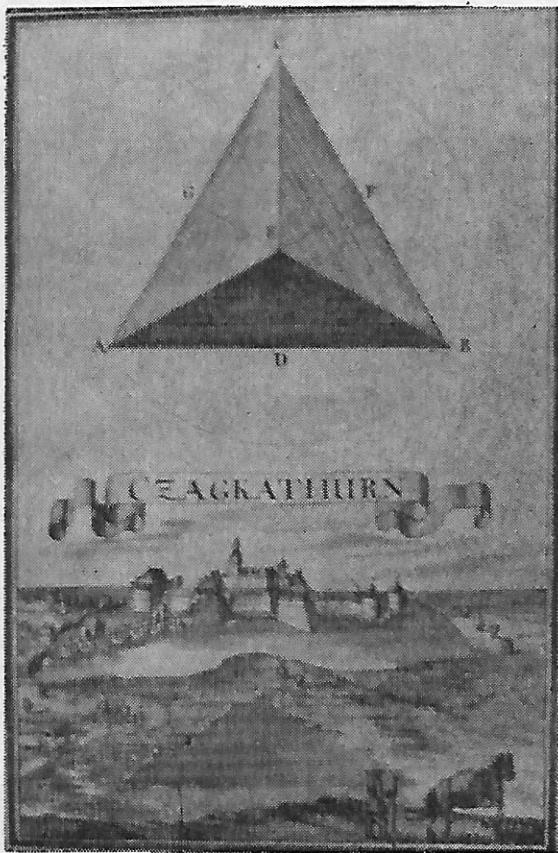
Sl. 2 — Čakovec, iz knjige E. B. von Birkensteina, Metropolitanska knjižnica, Zagreb

Među publiciranim prikazima čakovečkog dvora i utvrde koji su korišteni kao ilustracije određenih tekstova posebno je zanimljiv jedan koji je upotrebljen dva puta uz tekstove o povijesti metrologije. 11 Za porijeklo crteža se navodi zbirka Bendeffy u Budimpešti. U prvom planu tog crteža vide se dva mjernika koji s pe-toricom pomoćnika vrše izmjeru zemljišta me-