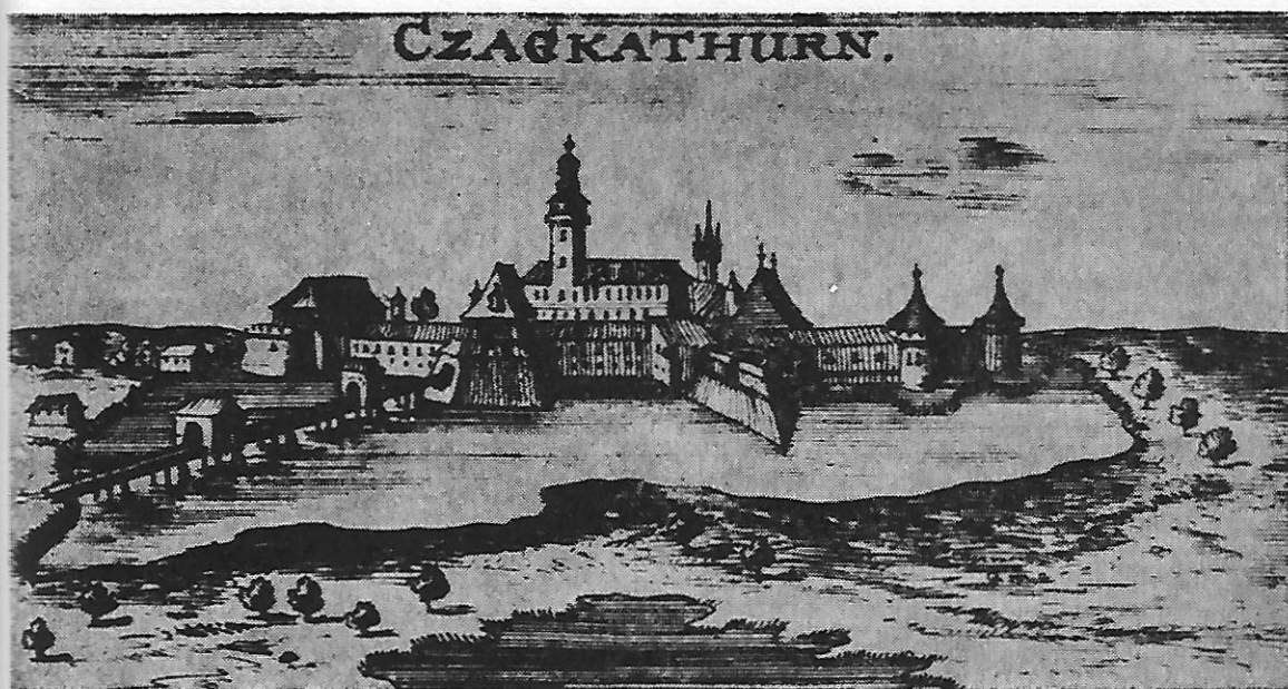
Sl. 3 — Čakovec, Sächsische Landesbibliothek, Dresden

todom triangulacije. U drugom planu je prikazan dvor i tvrđava Čakovec. Dvokatna građevina u obliku četverokuta s unutarnjim dvorištem i pravilnim nizom prozora na katovima okružena je visokim zidom s kulama. Na kuli na istočnom zidu je glavni ulaz do kojeg vodi drveni most preko jarka s vodom. Svi dijelovi crteža su veoma precizno naslikani. Iza bedema koji okružuju dvor naziru se manji izdvojeni objekti. Na sjevernoj strani uz šanac, na ledini, je manja prizemna izdužena kuća. Detaljno uspoređujući ovaj ne potpisani crtež dvora s tlocrtom plana dvora Čakovec koji je izradio G. G. Spalla 12 iz bečkog Vojnopovijesnog muzeja može se s velikom sigurnošću tvrditi da oba crteža pripadaju istoj cjelini. Tome u prilog ide činjenica da se manji objekti mogu naći unutar zidova tvrđave na istim mjestima kao i na Spallinom tlocrtu. Uz njegov plan u legendi pokraj tlocrta je opis namjene svih objekata uz dvor unutar zidina. Ranije spomenuti objekat s vanjske strane šan-