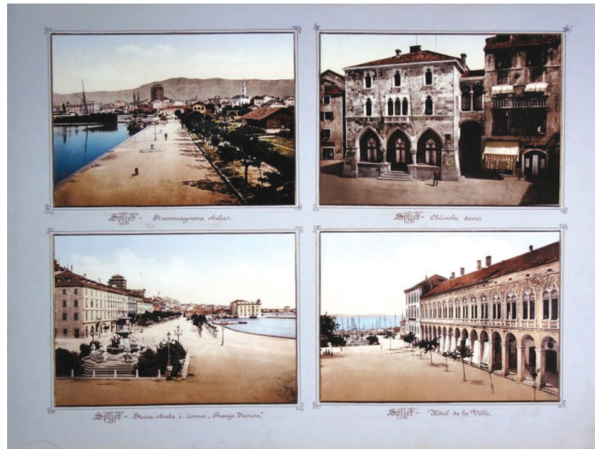
Slika 3. Splitski motivi