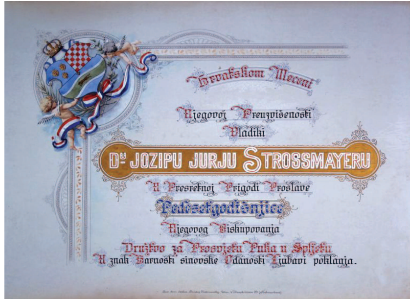
Slika 1. Naslovni list albuma