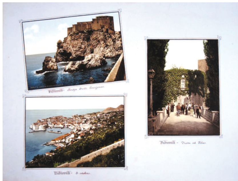
Slika 4. Motivi iz Dubrovnika