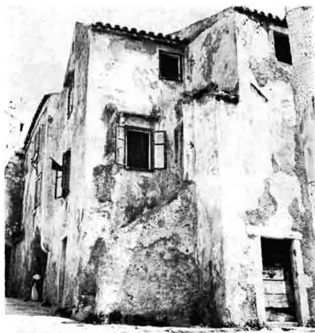
Sl. 5 — Starinska kuća u ulici Pavla Vitezovića br. 26

Ovim kratkim pregledom pokušali smo dočarati sliku Senja u doba djelovanja senjske glagoljske tiskare, arhitektonsku fizionomiju tadanjeg grada od kojeg je do dana današnjeg usprkos mnogobrojnim i raznorodnim uništavanjima mnogo bitnog ostalo sačuvano. Bila bi dužnost našeg vremena da to sačuvamo potomstvu, to više što je upravo Senj grad — a o tome jasno svjedoči njegova arhitektura — koji nije nikad potpao pod strane zavojevače, ni Turke ni Mletke, i koji odrazuje našu vlastitu kulturu.