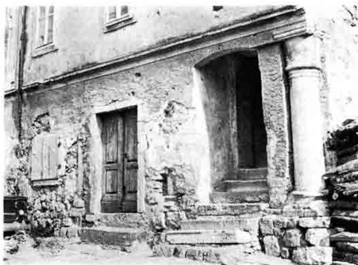
Sl. 4 — Pročelje gradske lože (?) iz početka XIII. stoljeća na Trgu žrtava fašizma 8 (»Mala Placa«)

Uz tu stambenu arhitekturu, uz crkvene građevine i uz fortifikaciju grada, u srednjovjekovnom gradu tipične su javne građevine koje služe određenim svrhama. Među ostalim, ali i prije svega, to je gradska vijećnica, sjedište upravne vlasti građana, i gradska loža što služi raznim svrhama javnog života grada. Gradska vijećnica općenito se u Evropi izgrađuje već tamo od XII. stoljeća, jer srednjovjekovnim gradovima, a tako i Senjom, upravlja gradsko vijeće. Njega spominje senjski statut g. 1388., a samu gradsku vijećnicu, često pod imenom »cancellaria«, spominju dokumenti daljnjih stoljeća. No srednjovjekovna građevina kao arhitektonski očito naglašeni objekt što ga još g. 1689. spominje Valvasor, porušena je već prema nešto kasnijem dokumentu iz 1698. g. Kasnije se nanovo izgrađuje, no da li se tada kada o lokaciji postoji grafička dokumentacija (u XVIII. stoljeću — 1785.) podiže na istom mjestu ili na novom? To ne znamo.