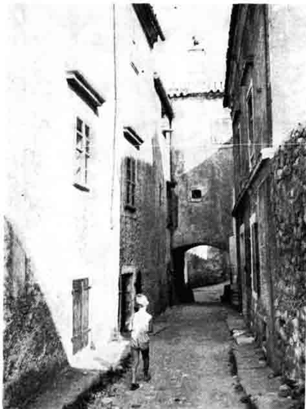
Sl. 3 — Stara ulica u predjelu »Gorica« u Senju

Još danas postoji cijeli niz stambenih kuća sličnog karaktera i izgleda unutar ranijih zidina koje govore o svom ranom, davnom porijeklu. No, gdje