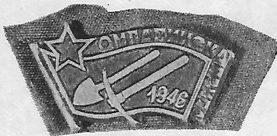
Sl. 1 — Brigadirska značka s omladinske pruge Brčko-Banovići

Naime, pored radova na izgradnji pruge, na ovoj prvoj saveznoj radnoj akciji omladine Jugoslavije, organiziran je bogat i sadržajan kulturno-prosvjetni rad. Kao i druge brigade i varaždinska je izdavala svoje zidne novine, organizirala čitalačke grupe, pripremala priredbe, a imala je i pjevački zbor. Po brigadama su organizirani i tečajevi za nepismene, te stručna i politička predavanja. Mnogi omladinci osposobljeni su na tečajevima za različita zanimanja kao npr.: za zidare, minere, mehaničare, telegrafiste, vozače i dr. Isto tako obučavani su za rukovanje različitim strojevima. Posebna pažnja na akciji posvećena je tjelesnom odgoju mladih. Pored svakodnevnih gimnastičkih vježbi često su organizirana atletska takmičenja i nogometni susreti u kojima su Varaždinci postizali visoke rezultate. Za svoj rad i postignute uspjehe na svim poljima brigada »Milica Pavlič«