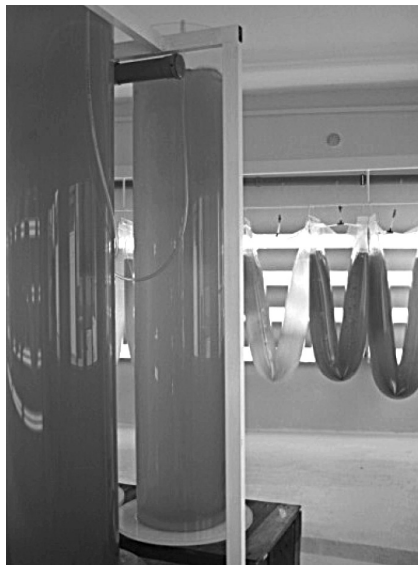
Laboratorij za uzgoj fitoplanktona